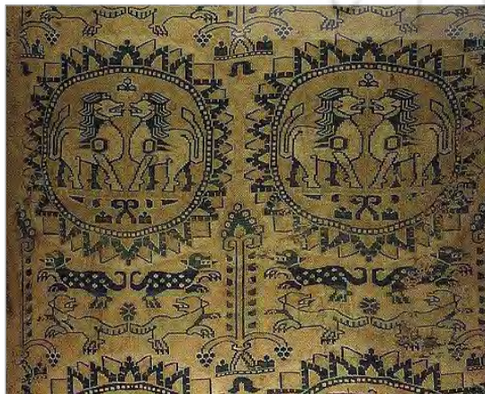
تصویر ۳. پارچه با نقش شیر، ابریشم، سده‌های ۹-۱۰ میلادی، موزه ویکتوریا و آلبرت لندن (URL: 2)

در این نمونه تصویری خاص، افزون بر نمادینگی‌های معمول، یال برجسته‌نمایی شده شیرهای غران، یادآور نوارهای پهن، بلند، موج و در اهتزاز ساسانی است که با تداعی نیروهای فوق‌زمینی ارتباط دارد. نوارهایی که با حفظ فره سلطنتی و فزونی متناسب بوده، یادآور اولین کالبد ایزد بهرام یعنی باد هستند که در بند دوم از کرده یکم در یشت چهاردم اوستا به آن اشاره شده است (اوستا، ۱۳۷۱: ۴۳۱). «نوارهای موج می‌توانند نشانه فره و بخت و اقبال بلند شاه بوده و به‌صورت ضمنی، به حمایت ایزد جنگ و نقش او در حفظ و افزونی فره و نعمت‌آوری حاصل از پیروزی در جنگ اشاره داشته باشند» (جلالیان، ۱۳۹۷: ۱۲). بدین قیاس در هنر ساسانی، تمام حیوانات از جمله شیرهای نر حاضر در این قطعه که دارای