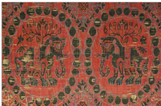
تصویر ۵. پارچه با نقش فیل، ابریشم، سده‌های ۱۲-۱۱ میلادی، موزه کوپر هیوئت نیویورک (URL: 4)