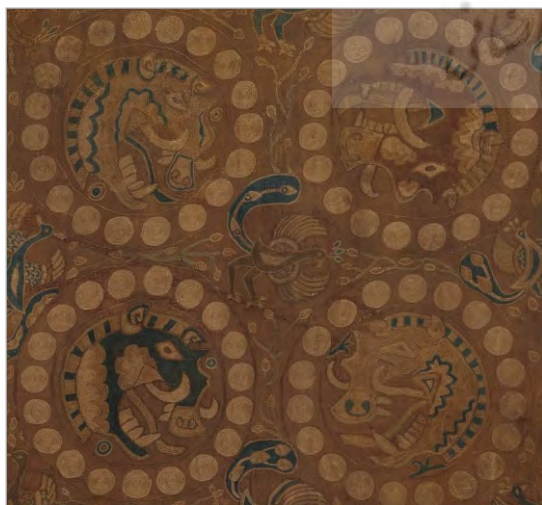
تصویر ۲. پارچه با نقش سر گراز، ابریشم، سده ۷ میلادی، موزه متروپولیتن نیویورک (URL: 1)

آمده‌اند. درباره ویژگی نقش گراز آنکه، از انواع جانوری رایج در هنرهای ساسانی بوده که به‌ویژه در سنگ‌نگاره‌های طاق بستان محل توجه قرار گرفته است. مهم‌ترین مسئله درباره این حیوان، اهمیت در جنگ‌ها به‌واسطه بهره‌مندی از نیروی فوق طبیعی است. البته در ایران عصر ساسانی، این جانور بیشتر به‌عنوان شکار استفاده می‌شد و غلبه بر آن، به معنی دست‌یافت بر تمام صفات او همچون نیروی فوق طبیعی بوده است. «گراز نر، نماد قدرت، ثبات قدم، شجاعت، حمله جسورانه و وحشی‌گری و درنده‌خویی است» (اخوان اقدم، ۱۳۹۶: ۸۹ و ۹۰). خاصه آنکه در کتاب اوستا، یشت چهارم مشهور به بهرام یشت، بند پانزدهم از کرده پنجم، گراز نر، یکی دیگر از شکل‌های مجسم ایزد بهرام معرفی می‌شود (اوستا، ۱۳۷۱: ۴۳۴)؛ به همین دلیل، جهت فزونی شوکت و اقتدار شاهانه در بیشتر صحنه‌های فتح و کامیابی ترسیم می‌شده است. ایزد بهرام، در ده هیئت خود را به زرتشت نشان داده که در یکی از این صورت‌ها، وی به شکل گراز ظاهر می‌شود. این شکل از ایزد بهرام، نماد شایسته برای نشان دادن نیرومندی بوده که در دوره ساسانی، محبوبیت بسیار داشته است (فیروزمندی شیرجینی و وثوق بابائی، ۱۳۹۳: ۹۴). این بازیابی نمادین از آن رو مورد استناد قرار می‌گیرد که نماد جانوری گراز، در میان حلقه مرواریدگون مدالیونی دال بر فره به تصویر درآمده است. در ژرف‌نگری بیشتر، «پنجمین تجلی ایزد بهرام، به‌صورت گراز تیزدندانی است که به یک حمله می‌کشد و خشمگین و زورمند است» (قلی‌زاده، ۱۳۸۸: ۳۴۳). چنین به نظر می‌رسد گراز به‌تنهایی و با محاط شدن در قاب‌های مدالیونی مرواریدگون که نشان از اهمیت تصویر دارد، نمادی