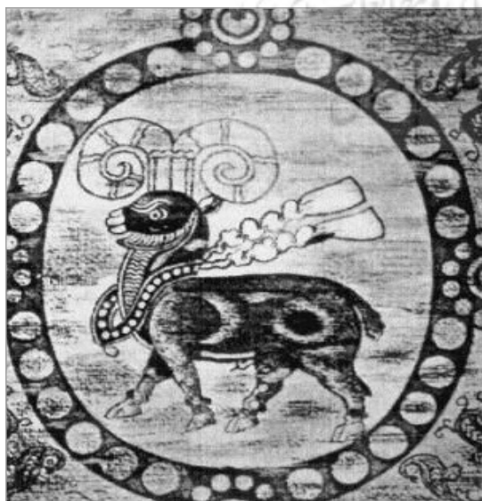
تصویر ۱. پارچه با نقش قوچ، ابریشم، سده‌های ۷-۶ میلادی، موزه منسوجات لیون فرانسه (گیرشمن، ۱۳۹۰: ۲۲۸)

در صورت ظاهری، قوچ به برخی از نژادهای گوسفند نر با شاخ حلقوی و پیچ‌دار اطلاق می‌شود، اما در راستای دست‌یابی به معنای نمادین، در فرهنگ دینی ساسانیان (مطابق با بند بیست و سوم از کرده هشتم در یشت چهارم اوستا که به بهرام یشت مشهور است) این جانور یعنی قوچ، نمود فره کیانی (مشروعیت سلطنتی) و هشتمین کالبد ایزد بهرام است (اوستا، ۱۳۷۱: ۴۳۵)؛ به همین دلیل، جهت فزونی شوکت و اقتدار شاهانه در بیشتر صحنه‌های فتح و کامیابی ترسیم می‌شده است. این معنی از آن‌رو تقویت می‌شود که نماد جانوری قوچ، با روبان در اهتزاز در میان حلقه مرواریدگون مدالیونی دال بر فره به تصویر درآمده است. «فره در صورت کلی، به معنای سعادت، شکوه و درخشش بوده و فره کیانی، خاص پادشاهان است. ایزد بهرام نیز مظهر نیرومندترین، پیروزمندترین و فرهمندترین ایزدان مینوی است. بهرام، خدای جنگ و تعبیری از نیروی پیشتاز مقاومت‌ناپذیر پیروزی است که به صورت‌های گوناگون از جمله قوچ، تجسم پیدا می‌کند»