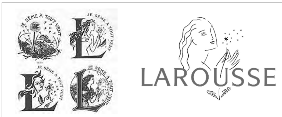
تصویر ۱. نشانه دانش‌نامه لاروس در گذر زمان (پهلوان، ۱۳۹۰: ۱۱۰)

جدول ۳. طراحی نشانه مؤسسه‌های علمی و انستیتوهای مختلف با کهن‌الگوی روشنایی و مشعل