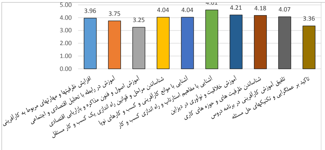
نمودار ۱. فرآیند پژوهش (نگارندگان)