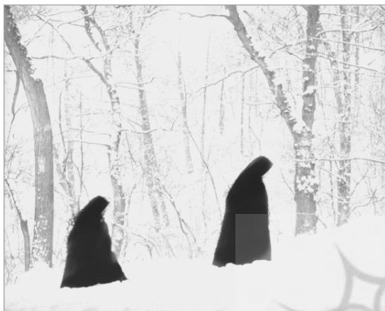
تصویر ۱. راه‌های پایین، رابرت هاوزر، ۱۹۵۴ (هاوزر، ۱۳۸۱: ۱۵)

که ممکن است چندان واقعی و حقیقی نباشد. در این رابطه می‌توان به تصویر ۳ که خانواده سلطنتی انگلستان را در سالروز پیروزی متفقین بر ژاپن نشان می‌دهد، اشاره نمود. عکاس برای تهیه این عکس با انتخاب‌های متعددی که پیش‌تر ذکر شد، روبرو بوده است؛ اما آنچه در نتیجه عمل جاننشینی و همنشینی عکاس مشاهده می‌شود، پایه و اساس تحلیل و خوانش بیننده را از عکس می‌سازد؛ چه بسا به کلی