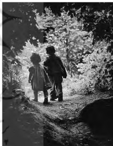
تصویر ۶. دروازه بهشت، یوجین اسمیت، ۱۹۵۵ (لاینز، ۱۳۸۸: ۱۱۶)

و بصری تهی می‌گردد (دقت کنید به شکل و وضعیت راه‌رفتن دختر و پسر که در بهترین حالت باهم هم‌نشین شده‌اند). همچنین، در تصویرهای ۷ و ۹، عکاس بر موضوعاتی در عالم واقع، به گونه‌ای قاب‌گذاری کرده که معنای عکس، از رابطهٔ تقابلی که عناصر باهم دارند، زاده می‌شود. عکاس، از رخدادی که در جریان بوده، تکه‌ای را در لحظه‌ای معین جدا نموده و با قاب‌نهادن بر گوشه و لحظه‌ای از امری واقعی و قراردادن عناصر متضاد در قاب، دید خلاق و نگاه تیزبین خود را نشان داده است. آنچه در این عکس‌ها به تصویر درآمده، صرفاً ثبت واقعیت یا رویدادی نیست، بلکه تفسیر عکاس از آن است که زادهٔ نوع قاب انتخابی عکاس و زاویه‌دید و چگونگی سامان‌بخشی عناصر با یکدیگر و استفاده از شگرد تقابلی است. این شگرد از یک‌سو، عکس را از متنی عادی به متنی جذاب و قابل تأمل تبدیل کرده و از دیگر سو، موضع عکاس را در رابطه با رویداد موردنظر بیان نموده است. برای درک بیشتر اهمیت رابطهٔ تقابلی در معناآفرینی عکس و جذابیت بخشی به آن می‌توان تصویرهای ۸ و ۹ را که دارای مضمون یکسانی هستند، با یکدیگر مقایسه نمود. در تصویر ۸، یکی از معضلات جامعهٔ بشری (قحطی و گرسنگی) به شکلی عادی ثبت شده است. در واقع، آنچه توجه مخاطب را جلب می‌نماید، سوژه عکس است؛ اما عکس تصویر ۹، قحطی و گرسنگی