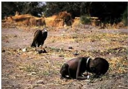
تصویر ۹. کودک گرسنه، سودان، کوین کارتر، ۱۹۹۳ (کوبر، ۱۳۸۹: ۳۲۲).