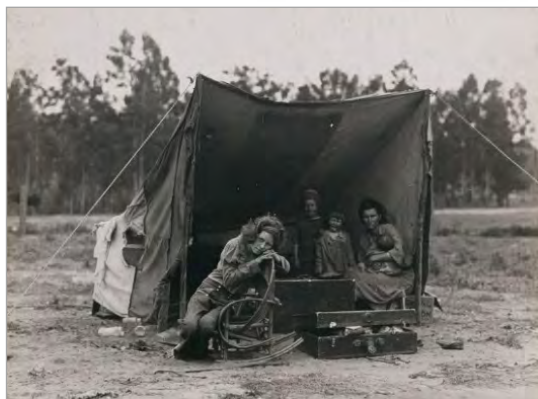
تصویر ۱۸. دورتیا لانگ، مادر و فرزندانش، ۱۹۳۶.