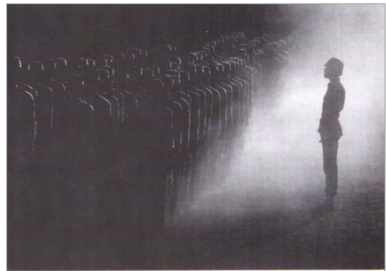
تصویر ۱۳. شبه‌نظامیان تامیل، نچوی، ۱۹۸۶ (کریم‌مسیحی، ۱۳۸۹: ۱۷۴)

یکی از مسائل مهم نشانه‌شناسی، نقش بافت و زمینه در آفرینش و دگرگونی معنای نشانه‌ها و متون نشانه‌ای است. بافت، شرایط دریافت و خوانش متن را فراهم می‌سازد. براساس این اصل، هر متن نشانه‌ای، معنایش با توجه به زمینه‌ای که در آن قرار دارد، ساخته می‌شود. متون، پیوسته براساس بافتی که در آن قرار می‌گیرند، مدلول‌های تازه و متفاوتی پیدا می‌کنند (سجودی، ۱۳۸۳: ۱۵۰). در این رابطه، عکس‌ها نیز معنای ثابت و واحدی با خود حمل نمی‌کنند و چهره یکسانی به مخاطبان خود نشان نمی‌دهند و یکی از عوامل مؤثر در رابطه با معناآفرینی عکس‌ها، زمینه و بافت ارائه آنهاست. بافت و زمینه عکس، یکی از مهم‌ترین و تأثیرگذارترین عوامل است که بر معنای درونی عکس تأثیر می‌گذارد و آن را تغییر می‌دهد. از سوی دیگر، بافت در دگرگونی معنای ضمنی هر عکس نیز مؤثر است. به‌طور کلی، عکس، بسته به این که در چه زمینه و بافتی مورد تماشای ارزیابی قرار گیرد، معنایش دچار تغییرات متفاوت گشته و گاه معنای متضادی به خود می‌گیرد. معروف‌ترین عکس در این رابطه، تصویر ۱۴ است. عکس مورد نظر در سه زمینه متفاوت به چاپ رسیده که در هر کدام، معنای خاصی به خود گرفته است. ابتدا در مجله مربوط به کافه‌ها در پاریس، بار دیگر در مجله‌ای در رابطه با مصرف الکل و سرانجام در مجله‌ای درباره فحشا (جی و هورن، ۱۳۸۸: ۴۸). عکس تصویر ۶ نیز برای اولین بار در