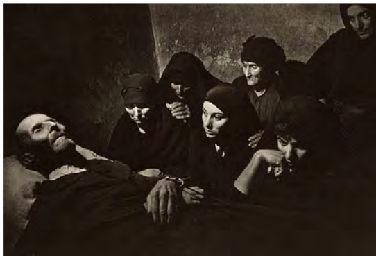
تصویر ۱۰. مرگ پیرمرد، دهکده اسپانیایی، یوجین اسمیت، ۱۹۵۱ (لاینز، ۱۳۸۸: ۱۱۴)

همچنین، آنچه عکس دروازه بهشت را عکسی ماندگار گردانیده، معانی ضمنی نهفته درون آن است. مخاطب ابتدا دو پسر و دختر را می‌بیند که در حال عبور از دالانی در طبیعت