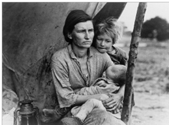
تصویر ۵. مادر مهاجر، دورتی لانگ،

www.loc.gov/pictures/item/fsa19998021539/p/ ) ۱۹۳۶