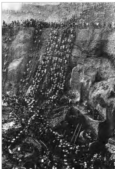
تصویر ۲۰. معادن طلای برزیل، سالگادو

اگرچه عکس‌های ساده دوربین محور نیز نیازمند تفسیرند، اما عکس‌های عکاس محور همچون نشانه و نمادهایی رمزآلودند که می‌باید رمزگشایی شوند و معانی و مفاهیم عمیق‌تر از آنی را دارند که به‌ظاهر نشان دهند. شاید بتوان این جمله را درباره این نوع از عکس‌ها کاملاً صادق دانست که «عکس، کلمه‌ای است که هزاران کلمه را دربردارد» (مایکلز، ۱۳۷۹:۱۹۶) به هر حال، عکس‌های عکاس محور، از یک ثبت دقیق و ماهرانه فراتر می‌روند و قوای فکری و احساسی مخاطب را تحت تأثیر قرار می‌دهند و او را به درگیر شدن اندیشمندانه با عکس فرامی‌خوانند. به‌طور مثال عکس تصویر ۲۰، دید نسبتاً عادی و گزارشی از صحنه ارائه می‌دهد، اما عکس تصویر ۱۶ که در همان فضا گرفته شده، از سویی توانایی و دید خلاق عکاس را به رخ می‌کشد و از دیگر سو، مخاطب را به کشف و آفرینش مفاهیم متعدد وامی‌دارد. اگر به جنبه‌های هنری عکاسی به‌عنوان یک رشته هنری، توجه و تأکید شود، عکس‌هایی که در آنها تفسیر و دید یگانه و خلاق عکاس، عنصر غالب و مسلط نباشد و بیشتر نشانگر قدرت ابزاری مکانیکی یا رویدادی مهم و جذاب باشد، اعتبار هنری و زیبایی‌شناسانه کمتری دارد. چراکه عکس‌های عکاس محور این مسئله را خاطر نشان می‌سازند که دوربین در دستان عکاس همانند قلم‌مو در دست نقاش است تا ایده و خلاقیت خود را با عکس نشان دهند. تفاوت در اینجاست که نقاش با سطحی خالی (بوم نقاشی) روبروست و به مدد قوه تخیل و ابتکار خویش، تصویر موردنظر خود را بر روی آن می‌کشد، اما عکاس از همان ابتدا با قابی پر مواجه می‌شود؛ بنابراین، عکاس می‌تواند از دریچه دوربین، دست به‌گزینش و ترکیب عناصر دنیای پیرامون