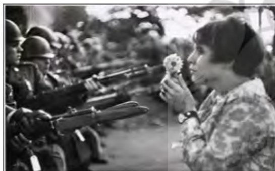
تصویر ۷. پنتاگون، مارک ریبرود، ۱۹۶۷ (www.akasee.com)