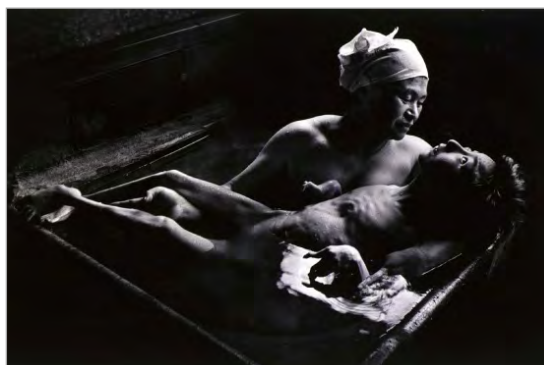
تصویر ۱۵. میناماتا، یوجین اسمیت، ۱۹۷۲ (برت، ۱۳۷۹: ۱۰۶)