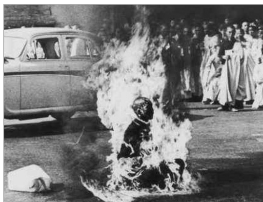
تصویر ۱۹. سایگون، مالکوم براون، ۱۹۶۳ (کریم‌مسیحی، ۱۳۸۹:۱۴۰)

اگرچه عکس‌های ساده دوربین محور نیز نیازمند تفسیرند، اما عکس‌های عکاس محور همچون نشانه و نمادهایی رمزآلودند که می‌باید رمزگشایی شوند و معانی و مفاهیم عمیق‌تر از آنی را دارند که به‌ظاهر نشان دهند. شاید بتوان این جمله را درباره این نوع از عکس‌ها کاملاً صادق دانست که «عکس، کلمه‌ای است که هزاران کلمه را دربردارد» (مایکلز، ۱۳۷۹:۱۹۶) به هر حال، عکس‌های عکاس محور، از یک ثبت دقیق و ماهرانه فراتر می‌روند و قوای فکری و احساسی مخاطب را تحت تأثیر قرار می‌دهند و او را به درگیر شدن اندیشمندانه با عکس فرامی‌خوانند. به‌طور مثال عکس تصویر ۲۰، دید نسبتاً عادی و گزارشی از صحنه ارائه می‌دهد، اما عکس تصویر ۱۶ که در همان فضا گرفته شده، از سویی توانایی و دید خلاق عکاس را به رخ می‌کشد و از دیگر سو، مخاطب را به کشف و آفرینش مفاهیم متعدد وامی‌دارد. اگر به جنبه‌های هنری عکاسی به‌عنوان یک رشته هنری، توجه و تأکید شود، عکس‌هایی که در آنها تفسیر و دید یگانه و خلاق عکاس، عنصر غالب و مسلط نباشد و بیشتر نشانگر قدرت ابزاری مکانیکی یا رویدادی مهم و جذاب باشد، اعتبار هنری و زیبایی‌شناسانه کمتری دارد. چراکه عکس‌های عکاس محور این مسئله را خاطر نشان می‌سازند که دوربین در دستان عکاس همانند قلم‌مو در دست نقاش است تا ایده و خلاقیت خود را با عکس نشان دهند. تفاوت در اینجاست که نقاش با سطحی خالی (بوم نقاشی) روبروست و به مدد قوه تخیل و ابتکار خویش، تصویر موردنظر خود را بر روی آن می‌کشد، اما عکاس از همان ابتدا با قابی پر مواجه می‌شود؛ بنابراین، عکاس می‌تواند از دریچه دوربین، دست به‌گزینش و ترکیب عناصر دنیای پیرامون