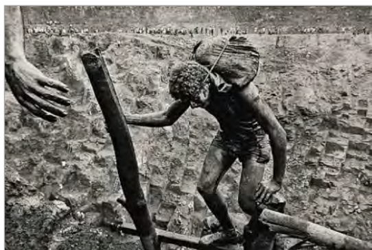
تصویر ۱۶. معادن طلای برزیل، سالگادو، ۱۹۸۶ (کریم مسیحی، ۱۳۸۹: ۱۷۸)

در مجموع، باتوجه‌به مباحث مطرح‌شده، می‌توان گفت با به‌کارگیری ابزارهای تحلیلی نشانه‌شناسی، عملکرد عکاس و نحوه برخورد او با پدیده‌های عالم واقعی و چگونگی بهره‌گیری او از امکانات و قابلیت‌های بیانی رسانه خویش مشخص می‌گردد. اگرچه «هدف اصلی نشانه‌شناسی، تبیین سازوکار تولید معنا در متون مختلف است» (گیرو، ۱۳۸۰: ۱۴)؛ با این حال، در نتیجه تحلیل و خوانش عکس‌ها از طریق ابزارهای تحلیلی نشانه‌شناسی، جنبه‌های متعدد آشکار و پنهان مضمونی، مفهومی، زیبایی‌شناسی و هنری عکس‌ها نیز تا حد زیادی آشکار می‌شود. در حقیقت، ابزارهای تحلیلی نشانه‌شناسی، نه‌تنها چارچوبی روشمند و علمی برای خوانش و فهم بهتر و بیشتر لایه‌های معنایی عکس‌ها ارائه می‌نماید، بلکه سطح کیفی (زیبایی‌شناسی) آنها را نیز بر ملا می‌سازند. نظریه پردازان و نشانه‌شناسان حوزه عکاسی، دسته‌بندی‌های مختلفی برای عکس‌ها قائل شده‌اند و بر مبنای این دسته‌بندی‌ها به توصیف و تحلیل و حتی نقد و ارزیابی عکس‌ها مبادرت ورزیده‌اند. در این راستا، باتوجه‌به اینکه دوربین، سوژه و عکاس، سه عامل اصلی تولید عکس‌اند، از طریق کاربست ابزارهای تحلیلی رویکرد نشانه‌شناسی، می‌توان تشخیص داد که عکس، مخاطب را به کدام یک از این سه عامل ارجاع می‌دهد. از این طریق، نوعی از دسته‌بندی عکس‌ها به‌دست می‌آید. بدین