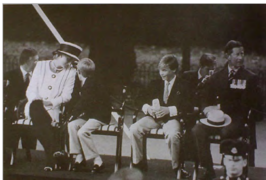
تصویر ۳. خانواده سلطنتی انگلیس، آژانس خبری بریتانیا (اکرت، ۱۳۸۹: ۵۹)