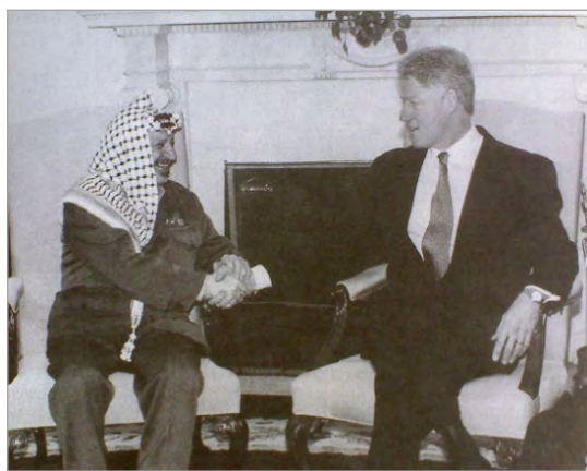
تصویر ۱۱. دیدار کلینتون و عرفات (اکرت، ۱۳۸۹: ۱۳۲)