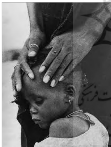
تصویر ۲. قربانی قحطی، اوی کارتر، ۱۹۷۴ (کوبر، ۱۳۸۹: ۲۹۶)