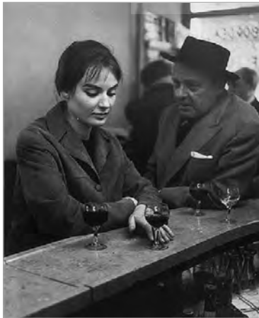
تصویر ۱۴. کافه در پاریس، رابرت دونو، ۱۹۵۸ (جی و هورن، ۱۳۸۸: ۴۹)

تعامل و گفتگوی میان متن‌ها و روشی را که در آن، خوانش یک متن در پرتو متون دیگر صورت می‌گیرد، بینامتنیت