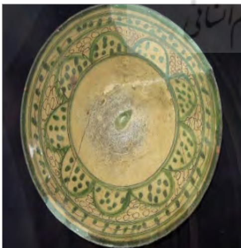
تصویر ۲. بشقاب سفالی با تزیین نقاشی زیررنگی (موزه کلیشادی ساری، نگارندگان)

سفال آمل، ۱ به روش نقش کنده و نقاشی زیررنگی تزیین شده و دارای تزییناتی به صورت نقش کنده روی بدنه ظروف بوده که با لعاب شفاف متمایل به رنگ سبز و زرد پوشانیده شده است. نقوش این ظروف شامل هاشورهای متقاطع، تزیین طوماری شکل و پرنده یا حیوان‌های خیالی است. ظروف ساخته‌شده از این دسته، اغلب شامل کاسه با کف صاف و بدنه کشیده و سفال قرمز رنگ است که با لایه‌ای از انگوب نخودی رنگ پوشش داده شده‌اند. نقوش ظروف ابتدا با شیء نوک‌تیز ایجاد شده و سپس قسمت‌های خاصی از ظرف نقاشی می‌شود. هدف از این کار، مهار کردن حد و مرز رنگ‌ها یا لعاب‌های رنگی است. سفالگران سعی کرده‌اند به این وسیله تفاوتی میان تکنیک خود با تکنیک نقش کنده زیر لعاب پاشیده ایجاد کنند. فائق توحیدی در "فن و هنر سفالگری"، در مجموع سفال آمل را علاوه بر مرزبندی رنگ‌ها به وسیله نقوش و ایجاد نقش‌هایی که با رنگ قهوه‌ای و سبز تزیین شده است، بیان می‌دارد که دارای شفافیت نیز هست که حاصل تالو لعاب سرب است (توحیدی، ۱۳۷۹: ۲۶۷). تقریباً تمامی سفالینه‌های کشف‌شده از مازندران چرخ‌ساز و به فرم کاسه و بشقاب و کوزه و تنگ هستند و با یکی از روش‌های ذکر شده تزیین شده‌اند (تصویر ۲).