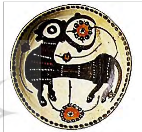
تصویر ۳. بشقاب سفالی با تزیین نقاشی زیررنگی (ارنست گروه، ۱۳۸۴: ۹۸)

جدول ۱. ویژگی های فرمی و ظاهری سفال ساری و تفکیک ویژگی های آن در نگاهی کلی براساس نمونه های موجود