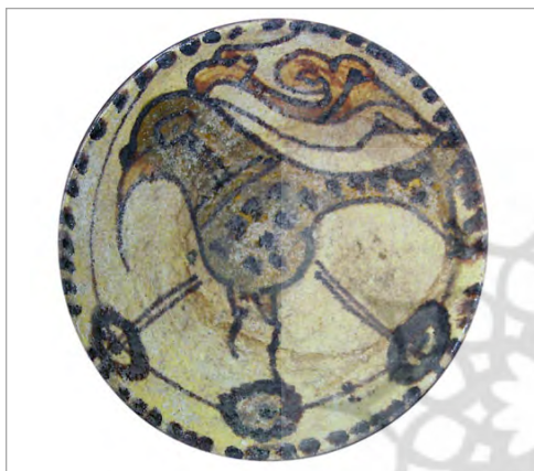
تصویر ۴. بشقاب با نقش پرنده به رنگ حنایی و آکر روی زمینه کرم (موزه مردم شناسی آمل).

جهت اختصار و سهولت ارائه مطالب، جدول ۱ به بررسی ویژگی های ظاهری و نقوش سفال های ساری می پردازد. چنانچه از جدول ۲ برمی آید ردیف نقطه های سفید کنار هم، از ویژگی های منحصر به فرد سفال ساری در قرون مذکور می باشند. نقش مایه تجریدی درخت که هم به عنوان نقش پرکننده و هم به عنوان نقش اصلی بر روی سفالینه ها نقش شده است که از مشخصه های سفال ساری می باشد. وجود نقش ماهی خالدار (مسبک) نیز خاص سفال ساری بوده که در بین شاخ بزکوهی نقش شده است.