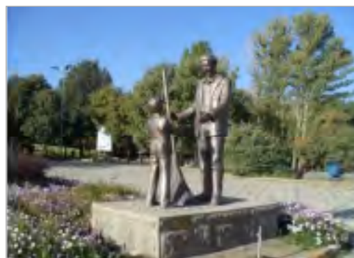
تصویر ۵. مجسمه مرد رفتگر در پارک مردم همدان