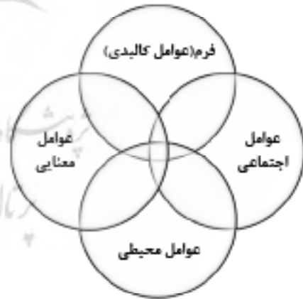
تصویر ۱. مؤلفه‌ها و ابعاد مفهومی فضاهای شهری براساس دیدگاه‌های اندیشمندان مختلف این حوزه (نگارنگان، ۱۳۹۴)

اسداللهی (۱۳۸۹) در یک کار تحقیقاتی، کاربردهای اصلی و حوزه‌های فعالیت گرافیک شهری را بدین صورت تقسیم‌بندی می‌کند: ۱. علائم تصویری خدمات عمومی شهری، علائم راهنمایی و رانندگی در شهرها و بزرگراه‌ها، هدایت تصویری