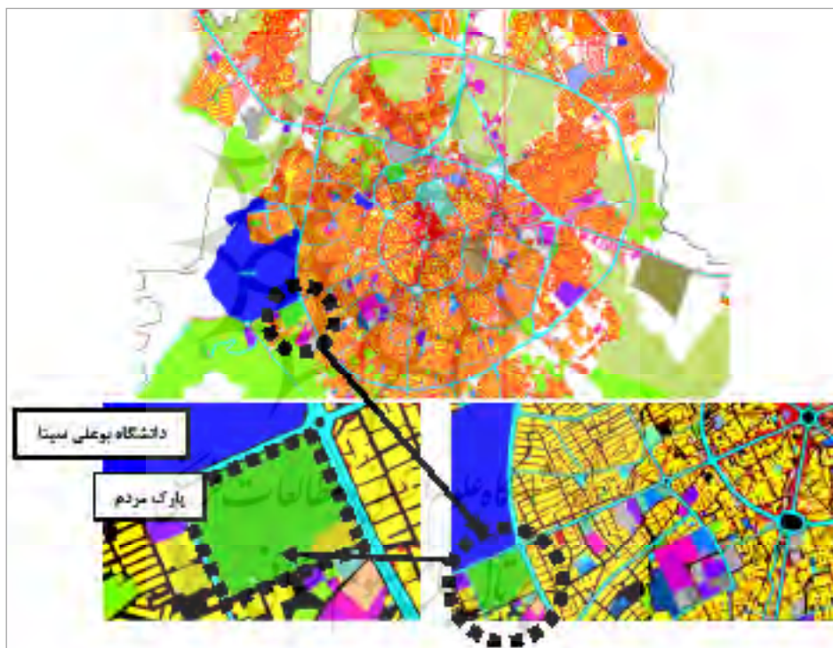
تصویر ۴. محدوده و نمونه‌موردی مطالعه (طرح تفصیلی شهر همدان)

همان‌گونه که در بخش مقدمه بیان شد، این پژوهش در پی پاسخ به دو پرسش اصلی است؛ پرسش اول در پی شناخت مؤلفه‌ها و ابعاد مؤثر گرافیک شهری در فضاهای شهری است. برای پاسخگویی به این سؤال، نظرات اندیشمندان و نظریه‌پردازان مختلف در زمینه فضاهای شهری و گرافیک شهری مورد بررسی قرار گرفت و نتایج به صورت مدل مفهومی پژوهش (تصویر ۳) ارائه شد. پرسش دوم تحقیق در رابطه با ارتباط گرافیک شهری در میزان حضورپذیری شهروندان در فضاهای عمومی و همچنین تعیین میزان تأثیر و ضریب همبستگی شاخص‌ها و معیارهای گرافیک شهری در حضورپذیری فضاهای شهری است. در پی پاسخگویی به این سؤال، پرسش‌نامه‌هایی با سؤالاتی در زمینه تأثیر ابعاد گرافیک شهری در حضورپذیری