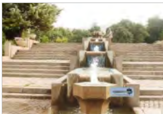
تصویر ۶. آب‌نما و فواره آب در پارک مردم همدان