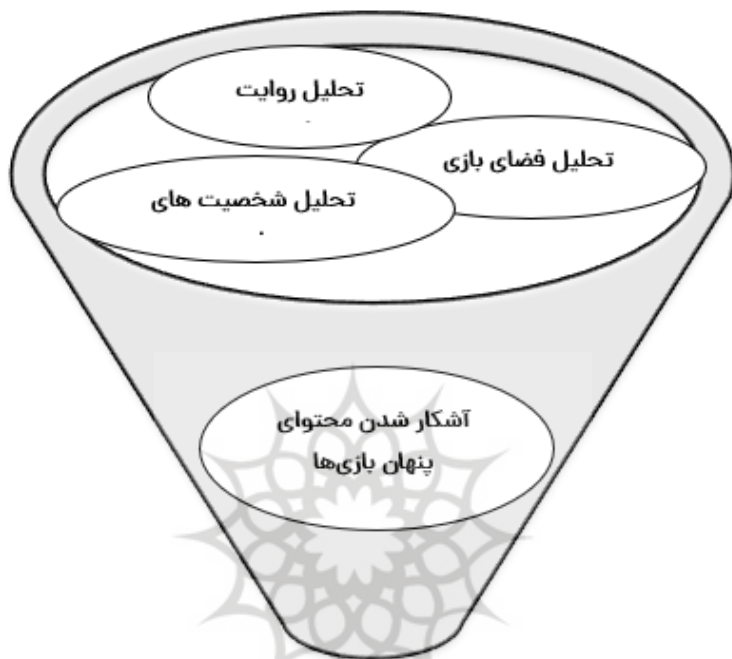
شکل ۲. الگوی تحلیل داده‌های بازی