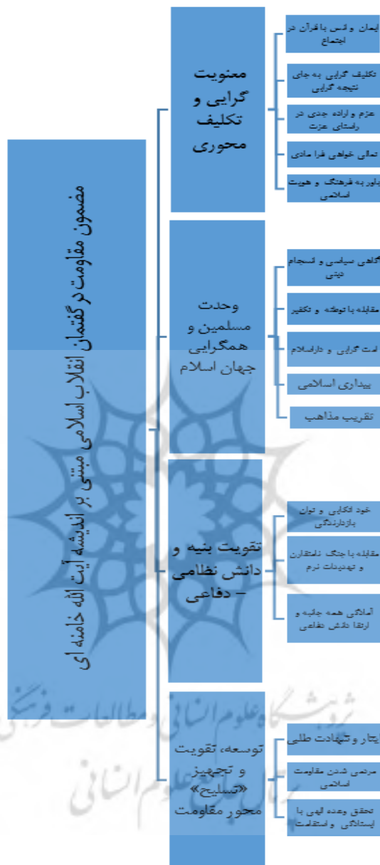
نمودار ۱. شبکه مضمونی مقاومت اسلامی در اندیشه مقام معظم رهبری