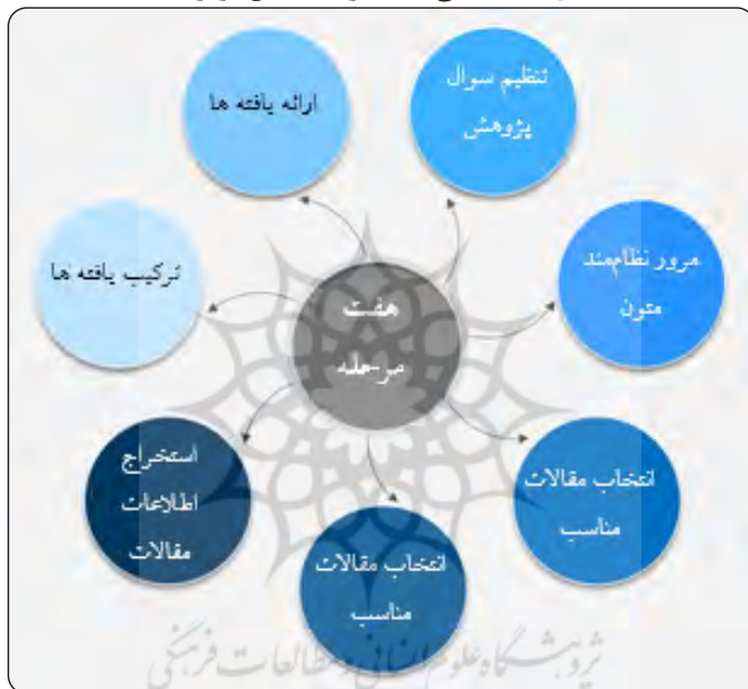
شکل ۱. بازنمایی هفت مرحله روش فراترکیب

نگرشی نظام‌مند برای پژوهشگران از طریق ترکیب پژوهش‌های کیفی مختلف به کشف موضوعات و استعاره‌های جدید و اساسی می‌پردازد و با این روش، دانش فعلی را اتقا می‌دهد و دید جامع و گسترده‌ای را در زمینه مسائل به وجود می‌آورد (کمالی، ۱۳۹۶). بازنمایی هفت مرحله‌ای راهبرد فراترکیب سندلوسکی و باروسو در شکل ۱ مشخص شده است.