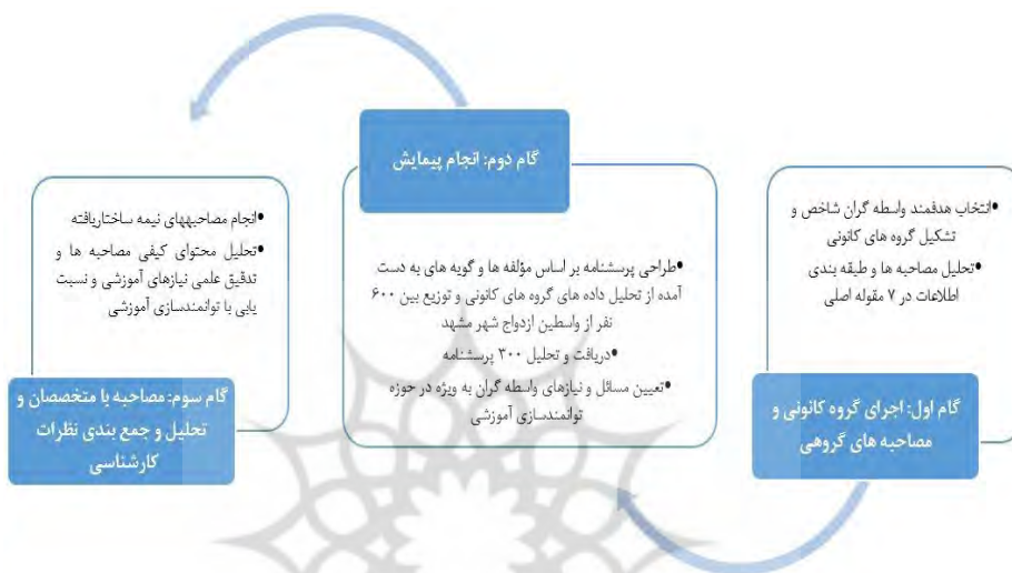
شکل ۱. مراحل اجرای تحقیق

آموزشی به واسطه‌گران است، دنبال شده است. تحلیل مصاحبه‌های نیمه ساختاریافته نیز با روش تحلیل محتوای کیفی ۱ تا مرحله مقوله‌بندی و کشف مقولات و زیر مقولات انجام شده است. در نهایت با توجه به مطالعات و بررسی‌های انجام شده در طی فرآیند نیازسنجی آموزشی، موضوعات و سرفصل‌های توانمندسازی آموزشی بر اساس جمع‌بندی نظرات کارشناسان و واسطین، از سوی پژوهشگران پیشنهاد می‌شود.