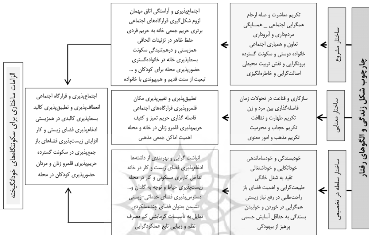
تصویر شماره ۲: مدل انتظام کالبد سکونتگاه‌های غیررسمی پهنه شمالی شهر تبریز در پاسخ به ساختار زندگی

در این بخش با اتکا به مقوله‌بندی مصاحبه‌های انجام شده در سه ساختار مشروع، معنایی و سلطه مشخص می‌شود که به طور کلی ساکنین الگوهای رفتاری غالبی در هر یک از این ساختارها داشته‌اند که محیط کالبدی و فضایی مختص به خود را می‌طلبد. در این رویه