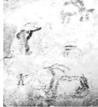
تصویر ۹. غار دوشه، نقش دو نفر در حال تیراندازی به دو گوزن، منبع: (ایزدینا، ۱۳۵۰: ۲۸۱)