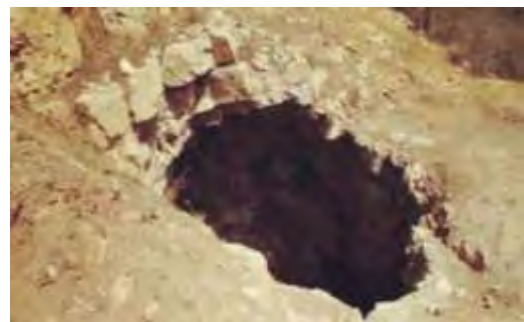
تصویر ۲. دهانه غار دوشه که به داخل آن فروریخته است.

در دوران پیش از تاریخ غارها مصرف‌های گوناگونی داشته‌اند. بعضی از غارها به‌عنوان محل سکونت بودند، بعضی مکان کشتار و برای مدت کوتاهی اقامتگاه شکارچیان بوده است. دسته دیگر این غارها برای اجرای مراسم‌های آیینی و دعا بوده و جنبه سکونت گاهی نداشتند. در رابطه با علت شکل‌گیری نقوش غار دوشه هنوز اطلاع دقیقی از وضعیت استفاده این غار در آن دوران در دست نیست اما با توجه به مشاهدات تصویری، به نظر می‌سد ساکنین اولیه لرستان به‌منظور تصویر کردن شرایط عادی زندگی خود، این نقوش را بر روی دیواره‌های غار دوشه که به شکل دایره‌ای