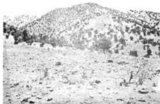
تصویر ۱. کوه «دوشه» که غار دوشه در آن واقع شده است.

«با بررسی‌هایی که از سال ۱۳۴۳ تا سال ۱۳۴۸ به وسیله هیئت‌های علمی دانشگاه‌های رایس ۹ و کمبریج ۱۰ انجام شد، در نقاط مختلف منطقه لرستان آثار تمدن از دوره‌های مختلف حجر به دست آمد. قدیمی‌ترین آثار تمدن سنگی از کوه «همیان» واقع در شمال کوه‌دشت و بعضی نقاط دشت «رومشکان» و نیز از «غار کنجی» واقع در جنوب خاوری دره خرم‌آباد و غارهای دیگر این دره یافت شد. ابزار مکشوفه از غار «کنجی» و غار «همیان» مربوط به دوره «پارینه‌سنگی» هستند و قشر «مستری» آن‌ها نزدیک به ۴۰,۰۰۰ سال تاریخ‌گذاری شده است. براساس کاوش‌های صورت گرفته، منطقه لرستان از دیرباز مسکون بوده است. از ابزار سنگی به دست آمده، زندگی و نوع معاش مردم دوره حجر لرستان قابل توجه و بررسی است. خوراک عمده آنان از گوشت حیواناتی تأمین می‌شده است که در اطراف اقامتگاه خود شکار می‌کردند» (ایزدپناه، ۱۳۵۰: ۲۳-۲۴). در این جوامع با توجه به تقسیم وظایفی که میان زنان و مردان صورت گرفته بوده است، زنان در کنار نگهداری از آتش و احتمالاً ساخت ظروف سفالی، در طبیعت به جمع‌آوری مواد خوراکی از قبیل ریشه گیاهان و میوه‌های خشک می‌پرداختند (گیرشمن، ۱۳۳۶: ۱۰-۱۱). با توجه به نتایج بررسی‌های صورت گرفته توسط مک بورنی، تاریخ نقاشی‌های غارهای تنگه «میرملاس» و «همیان» به هزاره دوم قبل از میلاد تخمین زده شده است. در این نقوش چند نوع حیوان با در نظر گرفتن مفاهیم مورد نظر مردمان آن دوران، تصویر شده که به طور مثال به نظر می‌آید از اسب برای شکار و جنگ استفاده می‌شده و این یکی از تجلیات قوم کاسی است که بر دیواره غارها نقش شده است (ایزدپناه، ۱۳۵۰: