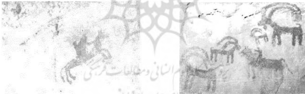
تصویر ۲۰. غار دوشه، نقش یک سوار در حال تاختن. منبع: (ایزدینپناه، ۱۳۵۰: ۲۹۱)

تناسبات: طی بررسی نقوش درمی‌یابیم در تصویر (۶) یک گرگ در اندازه بزرگ در میان چند بز که با توجه به تناسبات واقعی بسیار کوچک کشیده شده‌اند، به تصویر درآمده است. این تفاوت اندازه در نقش گرگ با دهانی باز، غلبه او بر بزها را نشان می‌دهد. در تصویر (۱۲) چند گرگ بزرگ در بالای صحنه رزمگاه نقش شده‌اند که با توجه به تناسبات میان اندازه این موجودات با انسان‌ها و دیگر حیوانات، گرگ‌ها با اندازه‌ای بسیار بزرگ کشیده شده‌اند و غلبه و برتری آن‌ها بر صحنه تصویر شده در پایین را نشان می‌دهد.