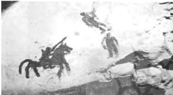
تصویر ۸. غار دوشه، نقش سواری که با نیزه به دو نفر پیاده حمله‌ور شده است و یکی از پیاده‌ها بر زمین افتاده است.

تناسبات: طی بررسی تناسب میان فیگورهای انسانی، حیوانات و ادوات جنگی می‌توان نتیجه گرفت انسان‌ها با تناسب متفاوتی کشیده شده‌اند. با توجه به تصویر (۱۲) در بالای نقوش، چند گرگ دیده می‌شود که حدوداً دو تا سه برابر اندازه انسان کشیده شده‌اند. کمی پایین‌تر نیز،