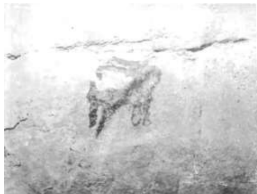
تصویر ۱۷. غار دوشه، نقش یک خرگوش، اندازه ۷×۵ سانتی‌متر. منبع: (ایزدپناه، ۱۳۵۰: ۲۸۸)