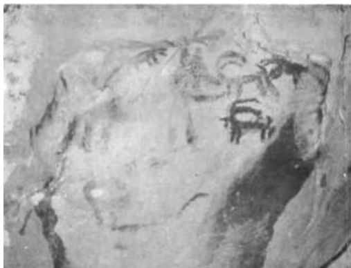
تصویر ۶. غار دوشه، نقش یک سگ شکاری در حال حمله به سه گوزن، اندازه ۲۸×۱۲ سانتی‌متر. منبع: (ایزدپناه، ۱۳۵۰: ۲۷۸)