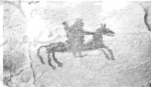
تصویر ۳. غار دوشه، نقش یک سوار که تیر و کمان بدوش چپ انداخته، اندازه ۹×۸ سانتی‌متر. منبع: (ایزدپناه، ۱۳۵۰: ۲۷۵)