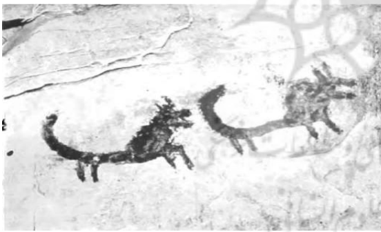
تصویر ۱۰. غار دوشه، نقش دو حیوان شبیه سگ به دنبال هم، اندازه ۱۰×۶ سانتی‌متر.