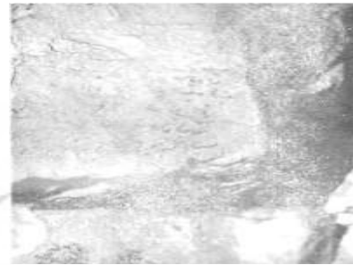
تصویر ۷. غار دوشه، قسمتی از کتیبه در پنج سطر، اندازه ۱۰×۷ سانتی‌متر.