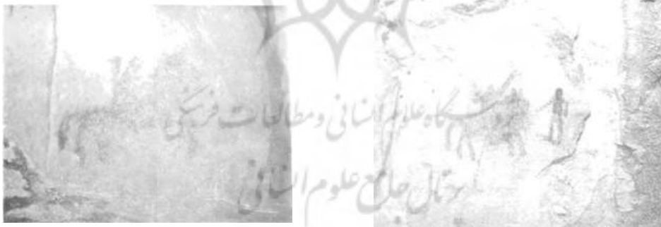
تصویر ۱۴. غار دوشه، سواری کمان بدوش در حال رفتن به طرف شرق، اندازه ۱۳×۹ سانتی‌متر.

حجم‌پردازی: در بررسی تصاویری که در آن‌ها به نقش بز پرداخته شده است درمی‌یابیم با آنکه تصاویر از نیم‌رخ تصویر شده‌اند، پاهای جلو