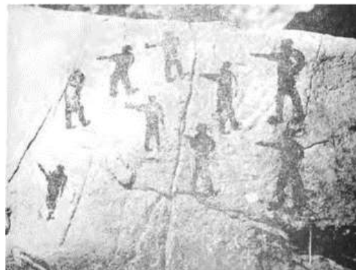
تصویر ۵. غار دوشه، نقش ۹ نفر که هر یک کمانی در دست دارند در حالت تیراندازی، اندازه ۱۸×۸ سانتی‌متر. منبع: (ایزدپناه، ۱۳۵۰: ۲۷۷)