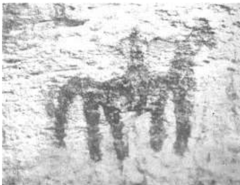
تصویر ۱۸. غار دوشه، نقش یک سوار در حال حرکت به جانب مشرق، اندازه ۱۴×۱۱ سانتی‌متر. منبع: (ایزدپناه، ۱۳۵۰: ۲۸۹)

عمق‌نمایی: در تصویر (۸) یک اسب و سوار به جهت مشرق کشیده