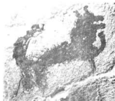
تصویر ۱۱. غار دوشه، نقش حیوانی شبیه سگ، در حال دویدن، اندازه ۱۲×۸ سانتی‌متر، منبع: (ایزدینا، ۱۳۵۰: ۲۸۳)