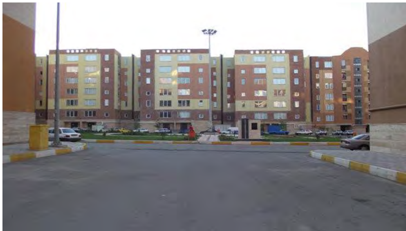
عکس شماره ۱. موقعیت محلات شهر جدید بهارستان.