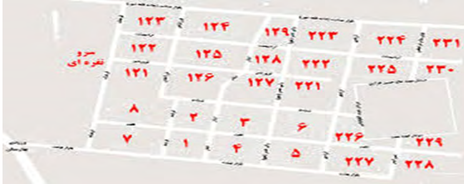
نقشه شماره ۱. موقعیت محلات شهر جدید بهارستان

این شهر از نظر ساختار جمعیتی دارای شاخصه‌های خاص خود است. در جدول شماره ۲ این مختصات جمعیتی به تفکیک بیان شده است.