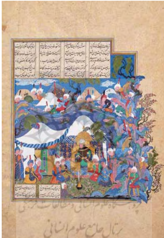
تصویر ۳: نگاره رستم از مرگ می‌گوید، منسوب به عبدالعزیز. شاهنامه طهماسبی، موزه هنرهای زیبا.

طبیعی است که پر بسامدترین ترکیب‌ها و واژگان در این ساقی‌نامه واژگان و ترکیب‌های «میخانه - ای» است از قبیل: پیرخرابات، رند، میخانه، می، باده، شراب، مطرب، ساقی، مست، خم، صبوچی و... جالب این است که باقر خرده به جای «مغنی» - جز چهار مورد- از «مطرب» استفاده کرده؛ یعنی خطابش با مطرب است و این امر نشان می‌دهد این کلمه که از محاوره گرفته شده در زبان او رفته رفته جای مغنی را گرفته و احتمالاً تازه‌تر و قابل فهم‌تر از «مغنی» تلقی می‌شده است.