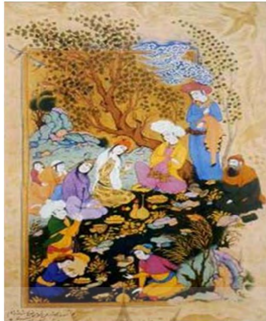
تصویر ۲: گلگشت با اشراف زاده، اثر رضاعباسی. (ماخذ: کنبی، ۱۳۸۹: ۹۲)