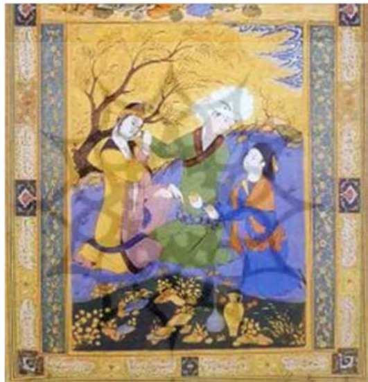
تصویر ۱: عشاق در صحرا، اثر رضاعباسی (مأخذ: کنبی، ۱۳۸۹: ۹۰).

تصویر شماره ۱ به عنوان یکی از نگاره‌های دوره صفوی روایتگر مضمون عشق است. مضمونی که در ساقی‌نامه‌های دوره صفوی و ساقی‌نامه محمدباقر خرد نیز دیده می‌شود.