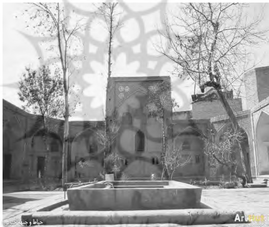
تصویر ۴: تصویر مدرسه عزت نساخانم. مبوط به دوره صفوی. در شهر اصفهان.

در دوران سلطنت شاه سلیمان صفوی، بانویی به نام عزت نسا خانم، دختر میرزا خان، تاجر قمی که شوهر خود را میرزا مهدی معرفی نموده، بانی و واقف مدرسه علمیه در جهت ترویج مذهب اهل بیت و ترویج معارف شیعه امامیه گردید که امروزه این مدرسه به میرزا حسین اشتهار یافته است. این مدرسه اگرچه از نظر مساحت و زیربنا کوچک است، اما از بناهای زیبا و مجللی است که در این عصر بین سال‌های ۱۰۷۷ تا ۱۱۰۵ ق. در اصفهان ایجاد شده و در بازار محله بیدآباد و در مجاورت مسجد سید واقع شده است (ریاحی، ۱۳۷۵: ۲۲۲).