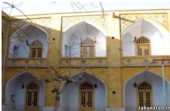
تصویر ۱: تصویر مدرسه دلارام خان، دوره صفوی، در شهر اصفهان. (منبع: نگارنده).

این مدرسه هم‌اکنون نیز طلبه‌نشین و تحت پوشش مرکز مدیریت حوزه علمیه اصفهان است. از جمله مدرّسان گذشته این مدرسه سیدحسین مدرس بوده است (ریاحی، ۱۳۷۵: ۱۶۷-۱۶۶). سنگ‌نوشته وقف‌نامه به طول ۹۵ و عرض ۷۰ سانتی‌متر است و همان‌طور که ذکر شد مربوط به ذی‌حجه سال ۱۰۵۷ ق. است. دو مواد از این وقف‌نامه به شماره ثبتی ۱۰۶ در بایگانی اداره کل اوقاف اصفهان موجود است که یکی بر روی کاغذ سفید مایل به زرد و دیگری بر روی کاغذ آبی نوشته شده است (جعفریان، ۱۳۷۵: ۹۷-۹۵).