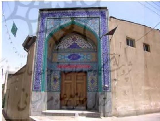
تصویر ۶: تصویر مسجد حاجیه خانم. در اصفهان. مربوط به دوره صفوی.

شاه خانم، دختر میرزا احمدبیک نمکی از زنان خیر و نیکوکار زمان سلطنت شاه‌عباس دوم صفوی بوده است. این بانو خود را از اعقاب خواجه نظام‌الملک طوسی (۴۰۸-۴۸۵ ه. ق) دانسته که این موضوع در سنگ‌نوشته‌ای به خط نستعلیق برجسته به انضمام میزان وقفیات مقررشده توسط او برای مسجد، در مسجد منسوب به او نصب‌شده است. این مسجد کنار میدان قدیم اصفهان و در کوچه معروف به نمکی واقع شده است (ریاحی، ۱۳۷۵: ۱۴۶-۱۴۵).