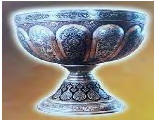
تصویر ۷: تصویر سنگاب شاه میرخانم. دوره صفوی.

حضرت امامزاده اسماعیل (علیه السلام) این حوض را حاجیه شاه میر بنت حاج میرزاعلی جزئی بر خوارى سنه ۱۰۴۹ هـ (هنرفر، ۱۳۵۰: ۱۰۴۹).