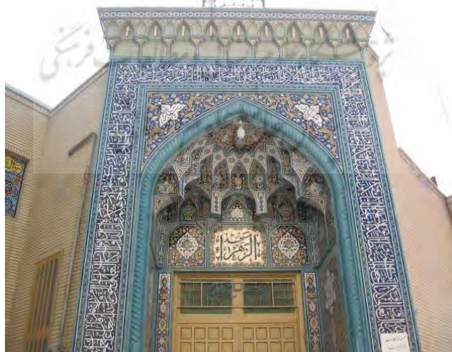
تصویر ۸: تصویر مسجد زهراخانم در اصفهان. دوره صفوی.