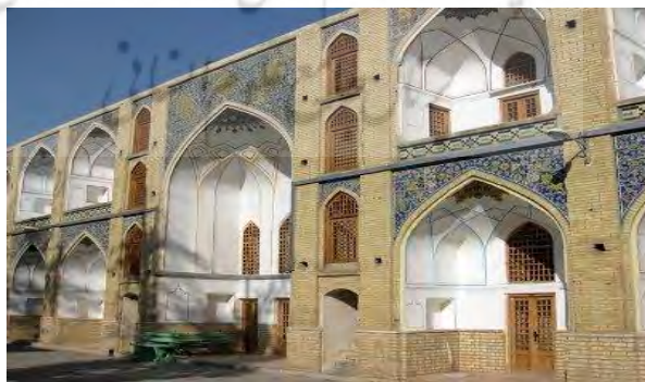
تصویر ۲: تصویر مدرسه حوری خانم. مربوط به دوره صفوی، در اصفهان. (منبع: نگارنده)

این مدرسه در بازار بزرگ شهر اصفهان واقع است. در این بازار دو مدرسه طلبه‌نشین از زمان شاه‌عباس دوم وجود دارد که یکی از آن‌ها را مدرسه جده بزرگ و دیگری را مدرسه جده کوچک می‌نامند. مدرسه‌ای را که بزرگ‌تر است جده کوچک شاه بنا کرده اما امروز اطلاق کلمه بزرگ و کوچک از طرف عموم مردم برحسب وسعت بناست. به این ترتیب که مدرسه بزرگ‌تر را مدرسه جده بزرگ و مدرسه کوچک‌تر را مدرسه جده کوچک می‌نامند (هنرفر، ۱۳۵۰: ۵۵۳).