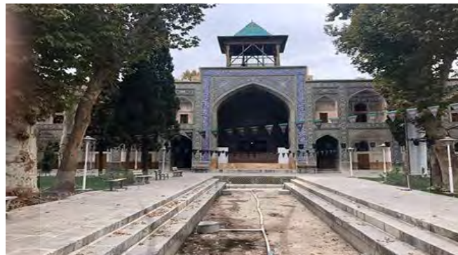
تصویر ۵: تصویر مدرسه مادرشاه در اصفهان. دوره صفوی.

هنوز روح معنوی، عظمت هنری و طبیعت با طراوت خود را حفظ کرده است، به طوری که وجود اشجار کهن سال، به خصوص چنارهای تنومند و نهر آبی که از وسط مدرسه می‌گذرد صفای خاصی به این بنای ارزشمند بخشیده است (ریاحی، ۱۳۸۵: ۲۰۰). حدود یک قرن پیش جهانگردی فرنگی عظمت این مکان را با وجود صدماتی که بر این بنا خاصه در زمان فتنه افغان و بعد از آن رفت، این‌گونه ستوده است: آیا در سراسر جهان مدرسه‌ای می‌توان یافت که در زیبایی و صفا از این کامل‌تر باشد و در آن اجزاء و عناصر گوناگون بدین‌سان به هم درآمیخته و درهم ترکیب و ذوب‌شده و اثری واحد پدید آورده باشد؟ (آنه، ۱۳۶۸: ۱۶۴).