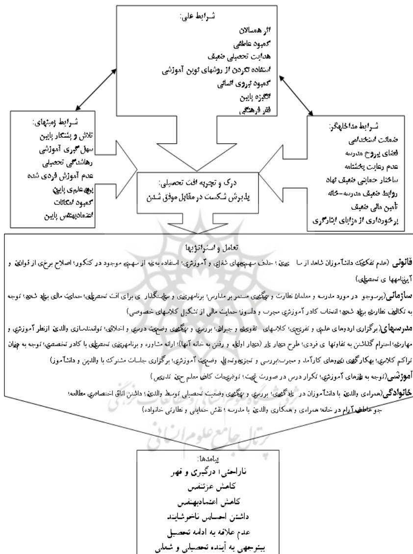
شکل ۲- مدل پارادایمک: افت تحصیلی به‌مثابه پذیرش شکست در مقابل موفق شدن

در مدل پارادایمک پژوهش (شکل ۲)، کنشگران درگیر در افت تحصیلی، این پدیده را به‌مثابه «پذیرش شکست در مقابل موفق شدن» درک و تجربه می‌کنند.