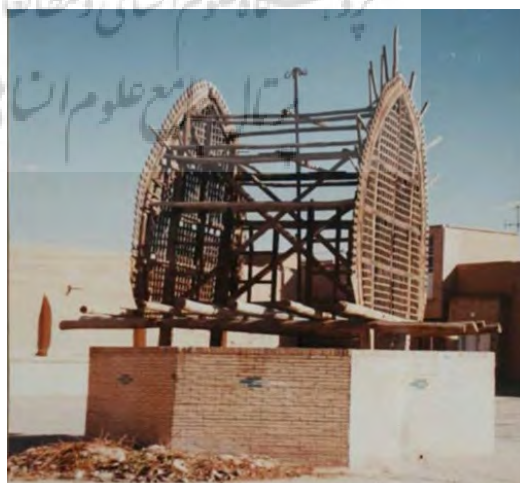
تصویر ۱۶: نخل قدیمی میدان وقت و ساعت که بر روی سقف ساختمان پایاب قنات وقف‌آباد در مرکز میدان قرار گرفته است.

از دیگر عناصر میدان که مربوط به دوره صفوی است، ۱۵ می‌توان به نخل قرارگرفته بر روی کلک یا سکوی میانی میدان (پایاب قنات وقف‌آباد) اشاره کرد. مشابه این نخل در بسیاری از فضاهای شهری تاریخی یزد از جمله میدان شاه‌طهماسب و میدان امیر چقماق وجود دارد. تا دهه ۴۰ شمسی، از این نخل در مراسم نخل‌برداری استفاده می‌شد اما از آن تاریخ به بعد، مراسم نخل‌برداری در میدان انجام نشد. ۱۶ بررسی عکس‌های هوایی دهه ۳۰، ۴۰، ۵۰ و بعد از آن نشان می‌دهد که مکان این نخل همواره بر روی سکو نبوده؛ گاهی در داخل حسینیه قرار داشته، گاهی در شمال کلک، گاهی در جنوب کلک و گاهی بر روی کلک؛ که در این چند دهه اخیر با توجه به فرسودگی، از روی کلک تکان نخورده و مکان آن ثابت مانده است.