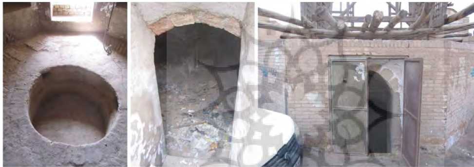
تصویر ۸: سمت راست: نمای بیرونی کلک و ورودی پایاب؛ وسط: فضای زیر کلک قبل از پاک‌سازی، آبان ۱۳۹۷؛ چپ: حوض قنات وقف‌آباد بعد از آشکارسازی و پاک‌سازی پایاب، تیر ۱۳۹۸

از دیگر عناصر تاریخی میدان، پایاب قنات وقف‌آباد مرتبط به قرن هشتم هجری قمری است. در هر دو کتاب تاریخ یزد و تاریخ جدید یزد مربوط به قرن نهم هجری قمری، اشاره شده که آب قنات وقف‌آباد از مجموعه مدرسه رکنیه می‌گذشته و در مسیر خود، به خانه استاد می‌رسیده است (جعفری ۱۳۳۸، ۱۵۰؛ کاتب یزدی ۱۳۸۶، ۱۱۷). ۹ همچنین در جامع مفیدی (مستوفی بافقی ۱۳۴۲) آشکارا به میدان وقت و ساعت به‌عنوان محل عبور آب وقف‌آباد اشاره شده است. ۱۰ این پایاب که تا دههٔ چهارم قرن گذشته، آب قنات وقف‌آباد در آن جریان داشته است، در دهه‌های اخیر به دلیل لوله‌کشی آب شهری و عدم وابستگی به آب قنات، مورد بی‌توجهی قرار گرفت و مدفون شد. در جریان مطالعات طرح بازآفرینی میدان وقت و ساعت، این پایاب به‌عنوان یک عنصر تاریخی مهم از قرن هشتم هجری قمری مورد شناسایی قرار گرفت و در تیرماه ۱۳۹۸ آشکارسازی و پاک‌سازی شد؛ به‌نحوی که اکنون حوض آب پایاب قابل مشاهده و شناسایی است (تصویر ۸). موقعیت این پایاب در مرکز میدان قرار دارد و هم‌اکنون نخل قدیمی میدان بر روی سقف آن مستقر شده است (تصویر ۹).