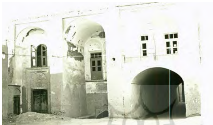
تصویر ۱۲: نمای شمالی میدان وقت و ساعت؛ در این تصویر از راست به چپ عناصر زیر دیده می‌شوند: سایاط ضلع شمالی میدان، ورودی آب‌انبار وقت و ساعت، ورودی خانه خردمند (فروشگاه فاضلی کنونی)، ورودی مدرسه افشار (پرونده ثبت ملی آب‌انبار وقت و ساعت)

میدان قرار دارد و مخزن آن با داشتن چهار بادگیر، در محدوده بیرونی میدان و در مجاورت گذر بازار نو در شمال میدان است. ورودی این آب‌انبار تا قبل از شروع طرح بازآفرینی میدان، مسدود و به مکانی برای پارکینگ دوچرخه تبدیل شده بود؛ حتی کتیبه سنگی آن در زیر یک بنر تبلیغاتی پنهان شده بود. خوشبختانه در جریان اقدامات اجرایی طرح بازآفرینی میدان وقت و ساعت، این آب‌انبار پاک‌سازی و آزادسازی شد.