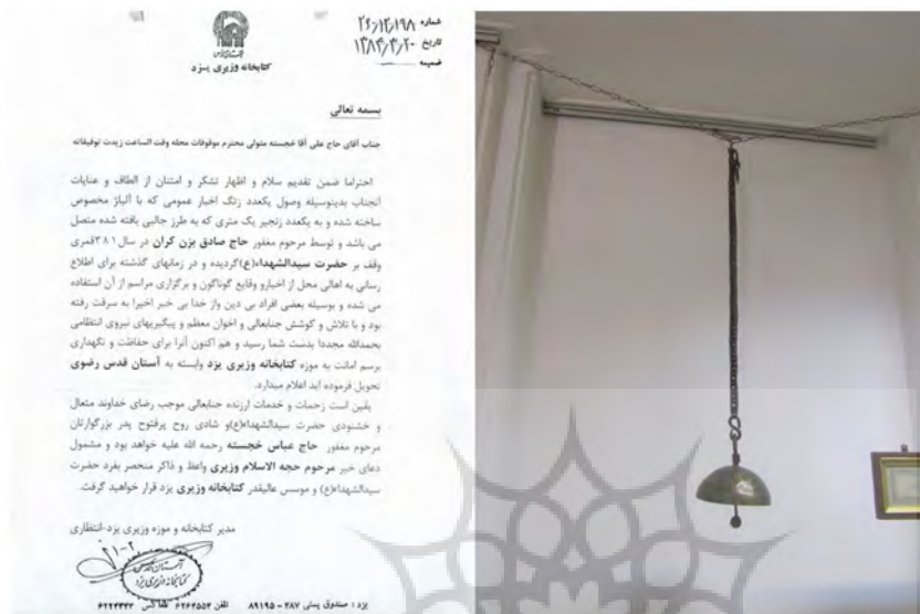
تصویر ۴: راست: زنگ نخل میدان وقت و ساعت؛ چپ: نامه مرتب با اهدای زنگ میدان به موزه وزیری

زنگ، نوشته کوتاهی نقر شده است که به وقف آن برای ابا عبدالله الحسین(ع) توسط حاج صادق بزنگ اشاره دارد و ماده تاریخ آن ۳۱عق، یعنی همزمان با آغاز حمله مغول به مناطق مرکزی ایران است.