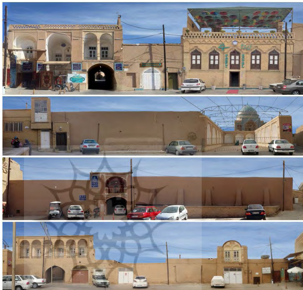
تصویر ۳: نما و بدنه‌های محصورکننده میدان وقت و ساعت؛ از بالا به پایین به ترتیب: نمای شمالی، نمای جنوبی، نمای شرقی و نمای غربی (شهبازی‌نژاد، ۱۳۹۸ الف)