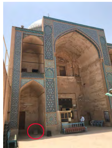
تصویر ۱۷: نمایی از بقعه سید رکن‌الدین و محل استقرار سنگ تاریخی در یکی از غرفه‌های نمای اصلی