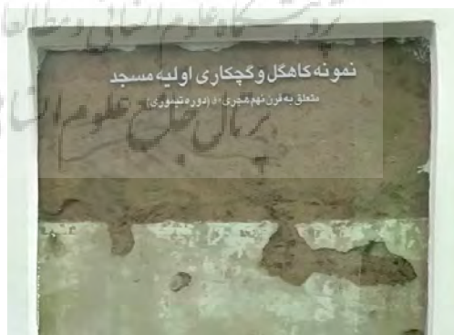
تصویر ۱۱: قابی از لایه‌های زیرین مسجد که در عملیات مرمت به صورت ویتترین درآمده و اندود نشده است.