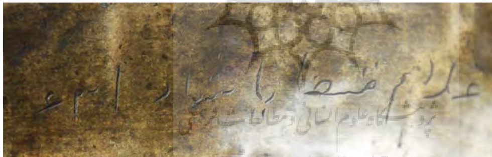
تصویر ۵: تصویری از انتهای نوشته نقرشده در داخل کاسه زنگ که به تاریخ ۶۳۱ اشاره دارد