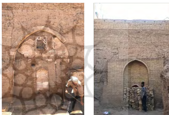
تصویر ۱۰: محراب نمازخانه واقع در ضلع شمالی میدان؛ تصویر سمت راست مربوط به لایه آجری است که در چند دهه پیش بر روی محراب تاریخی بنا شده بود و تصویر سمت چپ مربوط به بعد از لایه‌برداری از این محراب است.