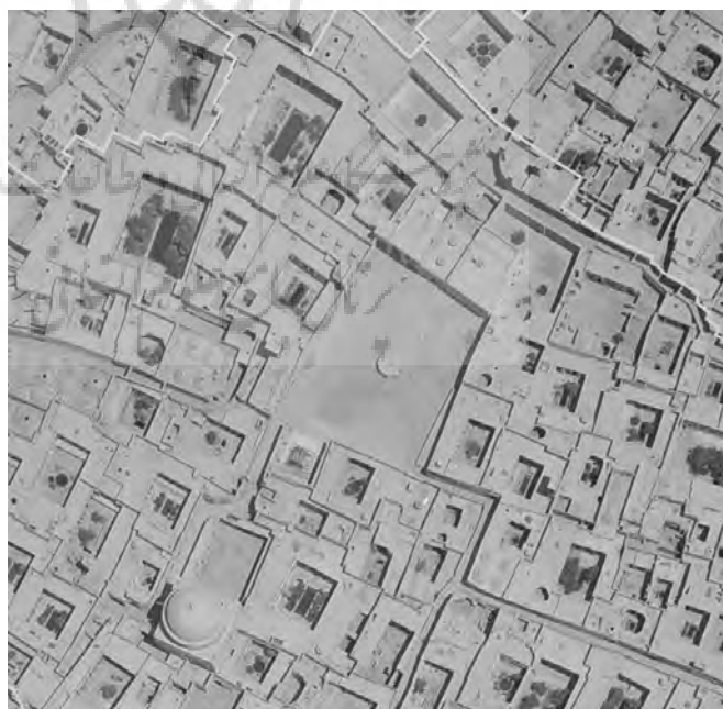
تصویر ۱: تصویر هوایی میدان در سال ۱۳۳۵ (پایگاه میراث فرهنگی شهر تاریخی یزد)

میدان وقت و ساعت یزد ۱ در مرکز هسته تاریخی شهر قرار دارد. مجاورت میدان با مسجدجامع و استقرار در محدوده ثبت جهانی شهر یزد، ترکیب دست‌نخورده و اصیل آن که از مداخلات دوره معاصر مصون مانده، تنوع سبک‌های معماری عناصر پیرامون آن از دوره‌های مختلف شامل ایلخانی، تیموری، صفوی، قاجاری و پهلوی، وجود سازه‌های آبی متنوع و وجه تسمیه آن که به رصد مشهور وقت و ساعت منتسب است، همگی بر اهمیت و ارزش این میدان تأکید دارد. این میدان محل اتصال چهار محله قدیمی یزد شامل محله وقت و ساعت در شرق، محله بازار نو در شمال، محله شاه ابوالقاسم در غرب و محله چهارسوق در جنوب آن است. شکل هندسی میدان نزدیک به مربع به ابعاد حدود ۴۰ متر است ولی بدنه‌های آن از امتداد کاملاً مستقیم و زوایای راست‌گوشه کامل تبعیت نمی‌کنند و شکلی نسبتاً ارگانیک دارند که علت آن تقدم و تأخر تاریخی شکل‌گیری بناهای مختلف در پیرامون آن است. وجه تسمیه این میدان مأخوذ از تأسیسات نجومی و رصدخانه‌ای در قرن هشتم هجری قمری به همت سید رکن‌الدین محمد قاضی بوده است که امروز اثری از آن دیده نمی‌شود. ۲ ترکیب فعلی میدان به دلیل مصون ماندن از خیابان‌کشی‌های دوره معاصر، ترکیبی اصیل و یکپارچه است (تصویر ۱ و ۹).