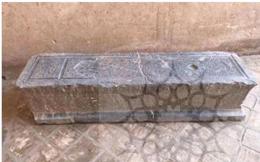
تصویر ۱۸: تصویری از سنگ قبر میدان وقت و ساعت که هم‌اکنون در بقعه سید رکن‌الدین نگهداری می‌شود.

از دیگر عناصر میدان می‌توان به سنگ قبر سیاهی ۱۷ اشاره کرد که آن را به الله قلی بیگ، وزیر یزد در دوره شاه سلیمان صفوی، منتسب کرده‌اند (تصویر ۱۸). این سنگ قبر در دهه ۷۰ پای دیوار حسینیّه وقت و ساعت قرار داشت و مردم محلی از آن به‌عنوان سکویی برای نشستن و استراحت استفاده می‌کردند. در نیمه دهه ۷۰، این سنگ به داخل غرفه جنوبی حسینیّه وقت و ساعت جابه‌جا شد و در دهه ۹۰ و در جریان عملیات توسعه حسینیّه، به داخل صحن بقعه سید رکن‌الدین منتقل گردید و از آن زمان تاکنون در آنجا قرار دارد (تصویر ۱۷).