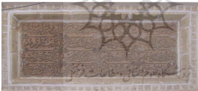
تصویر ۱۳: کتیبه سنگی آب‌انبار وقت و ساعت به خط نسخ و به تاریخ ۱۱۲۱ق