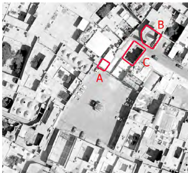
تصویر ۱۵: جانمایی عناصر تاریخی در میدان وقت و ساعت؛ A: ورودی آب‌انبار وقت و ساعت، B: مخزن آب‌انبار وقت و ساعت، C: مسجد دوره تیموری