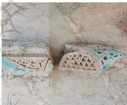
تصویر ۲۱: تزیینات نیم‌ستون‌های پیچ‌دار مسجدجامع مظفری کرمان