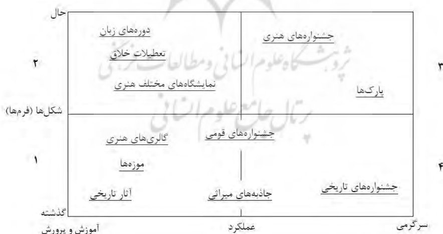
شکل (۱). گونه‌شناسی از جاذبه‌های گردشگری فرهنگی

ارتباط گردشگری و فرهنگ در حال تبدیل شدن به یک امر طبیعی و عادی است. بسیاری از ابعاد گردشگری معاصر عناصر فرهنگی هر جامعه را ارائه می‌دهند. شکل (۱) به لحاظ بصری بازنمایی مفیدی توسط ریچاردز از یک محیط گردشگری فرهنگی را نشان می‌دهد. در این شکل، دو مقیاس - اشکال گذشته / حال و عملکرد آموزش و پرورش / سرگرمی تا آنچه که برای گردشگران اجرا می‌شود؛ مانند صحنه جشنواره‌ها و همچنین فرم‌هایی که می‌تواند تقریباً تحرکی برای صنعت گردشگری باشد که نمایشگاه‌های هنری و دوره‌های زبان را در بر می‌گیرد.