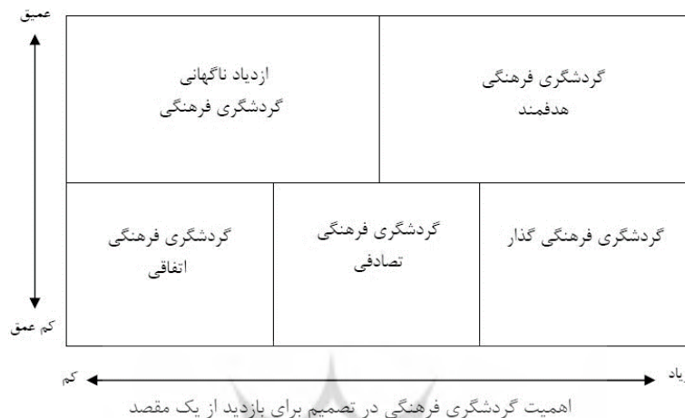
شکل (۳). گردشگری فرهنگی

تولید فرهنگی خواهد شد. شکل (۳). در این مدل، شاخص‌های مورد استفاده، تجربه عمیق و به دنبال آن اهمیت گردشگری فرهنگی در تصمیم برای بازدید از یک مقصد است.