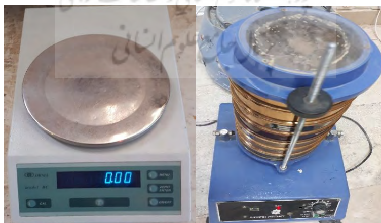
شکل (۳). دستگاه شیکر و ترازوی مورد استفاده جهت آنالیزها