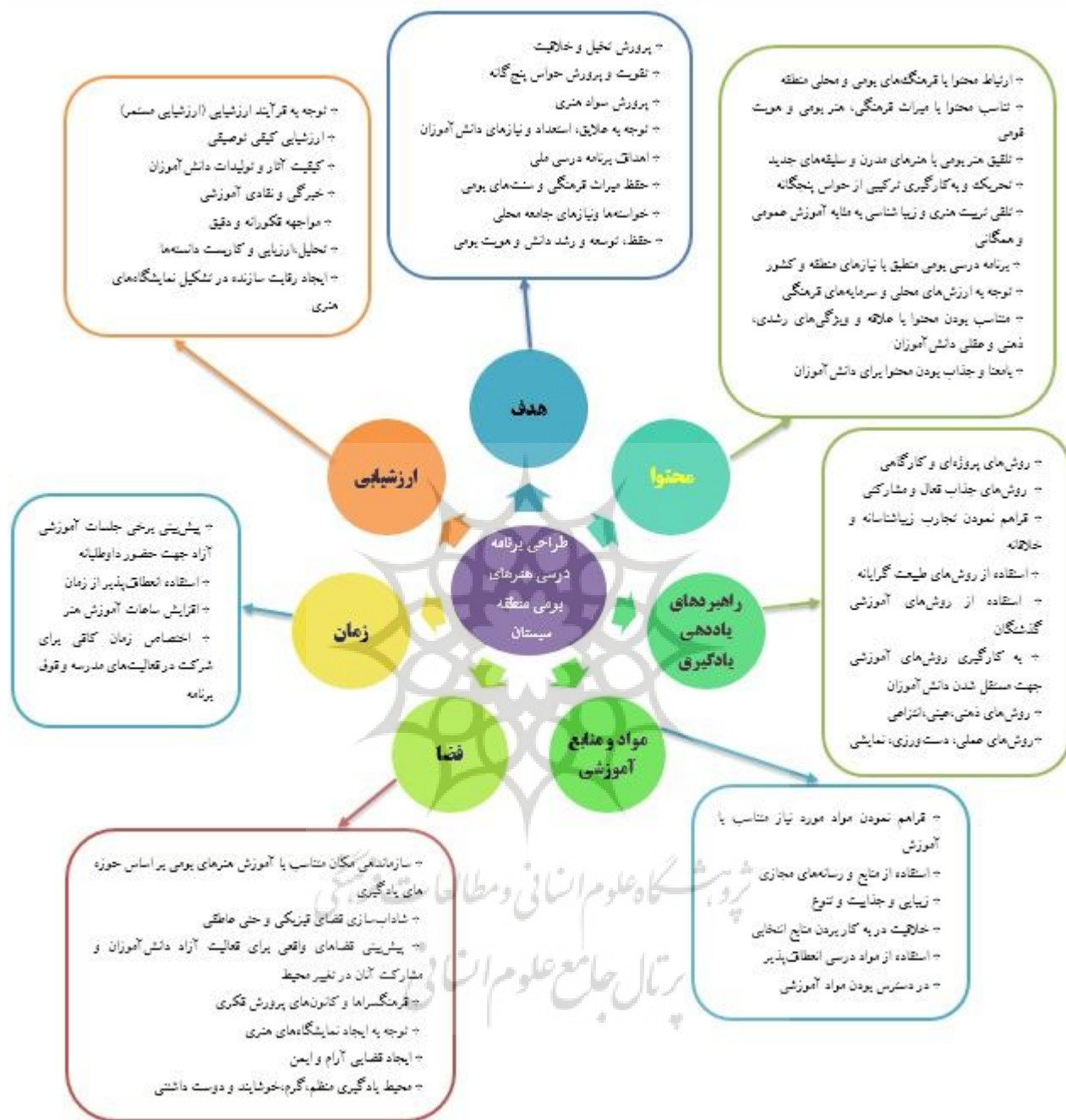
جدول ۲. الگوی پیشنهادی برنامه درسی هنرهای بومی منطقه سیستان

با توجه به مؤلفه‌های شناسایی شده، الگوی پیشنهادی برنامه درسی هنرهای بومی منطقه سیستان به صورت ذیل ترسیم شده است: