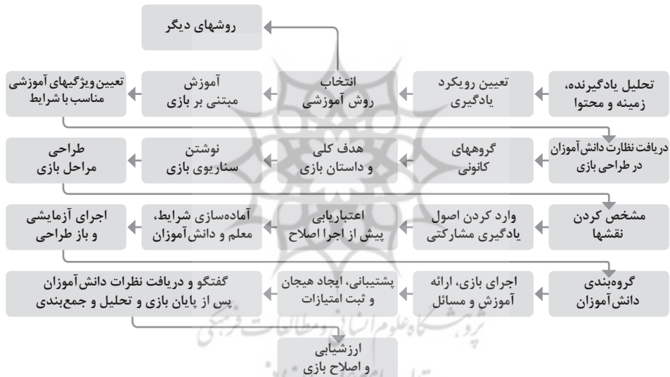
شکل ۳. چارچوب اولیه طراحی بازی آموزشی

به منظور دستیابی به پاسخ سؤال ۱ منابع طراحی آموزشی، منابع طراحی بازی آموزشی، اصول طراحی محیط‌های یادگیری سازنده‌گرایی و ویژگی‌های بازی آموزشی مبتنی بر سازنده‌گرایی و فرایند اجرای بازی مورد بررسی قرار گرفت. بر اساس منابع مشخص شد که مواردی چون یادگیرنده-محوری، فعالیت‌های اصیل (جالب و مرتبط بودن مسئله و فرایند بازی با یادگیرنده)، مسئله-محوری و ایجاد چالش در یادگیرنده، انگیزه و پاداش درونی، مشارکتی بودن، راهنمایی، بازخورد و پشتیبانی و تسهیلگری مناسب، توجه به بحث و گفتگو در بازی و مشارکت یادگیرندگان در طراحی و تولید بازی از ویژگی‌های بازی‌های آموزشی سازنده‌گرایی است که در ارائه الگو و طراحی بازی آموزشی همسایگان رعایت شد و در نتیجه شکل شماره ۲ برای فرایند طراحی بازی آموزشی ارائه و طبق آن بازی همسایگان ایران طراحی و اجرا شد.