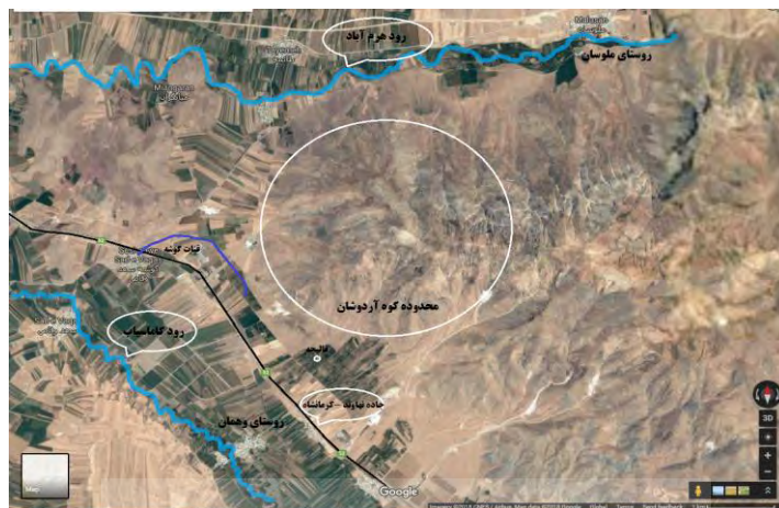
نقشه شماره ۲: محدوده پیرامونی کوه آردوشان

می‌زیست گاوی بود که زمین بر یکی از شاخ‌های آن برده می‌شد و هنگام تحویل سال، آن را از شاخی به شاخ دیگر جابه‌جا می‌کرد و این چنین نوید شروع سال نو را می‌داد» (بهار، ۱۳۹۶: ۲۴۵). در نوشته‌های کهن ایرانی نام گاوهای مقدس و داستان‌های آن همانند گاو سر سیوک یا ایودات، گوشورون، گاو «شریشوک»، گاو «مرزیاب» و «داستان گاو و هجرگا» آمده است (سجادی‌راد، ۱۳۹۰: ۳۳).