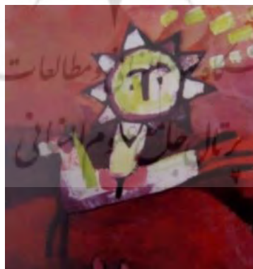
شکل ۶- حذف پرسپکتیو در کتاب (اوجی) علی نامور

حذف ژرفانمایی (پرسپکتیو): کنار گذاشتن تناسب و دیگر قواعد مرسوم در نقاشی کودکان در تشخیص اندازه ی ظاهری پدیده ها در نمای دور یا نزدیک آن تجربه ای ندارند و فرایند ژرفانمایی که نیاز به فرگیری دراد، تقریبا در سن نوجوانی قابل درک است.