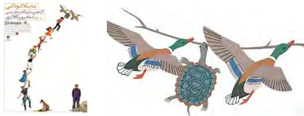
شکل ۲- تصویر سازی برای کتاب درسی پرویز کلانتری

تصویر سازی بیننده را به فکر کردن تشویق می کند تا بیش از آنچه را که در متن وجود دارد به تصور آورده به درک بیشتر و عمیق تری از موضوع برسد. تصویرسازی بزرگ مانند داستان ها و حکایات بزرگ هستند. در اینجا بیننده باید فعالانه درگیر موضوع باشد تا به درک بیشتر و عمیق تری از پیام برسد. اگرچه شاید مفهوم اصلی در ابتدا درون متن پنهان به نظر برسد و هنگامی که بیننده تصویر را منتشر کرد ارتباط به طور کامل برقرار می شود. تصویر سازی باشکوه باهنر و مهارت و تفکر خلاق پیوند دارد. خلاصه کردن طرح برای تصویرساز، مهم ترین بخش تفکر خلاقانه با خلاصه طرح پروژه جدید آغاز می شود خلاصه طرح اولیه، مرحله ای است که در آن اطلاعات زیر بنایی و پایه ای درباره پروژه جمع آوری میشود [۵]. به گفته اشو «خلاقیت واقعی از روی یادآوری نیست، بلکه از روی آگاهی است. تو باید آگاه تر شوی. هر قدر آگاهی تو بیشتر باشد، تور تو بزرگتر خواهد بود و مسلم است که ماهی بیشتری به تور خواهد افتاد» [۶]. بی تردید خلق یک اثر تصویر سازی مستلزم دانستن مبانی این حرفه می باشد. اما مهم تر از آن ایده و تفکرات تصویرگر می باشد که می تواند یک اثر مصور را به بهترین شکل ممکن عرضه نماید. بنابراین هنرمندان تصویرگر با تصویر سازی، شناخت و ویژگی ها و سبک های هنری گوناگون می توانند در مسیر دستیابی به ایده های نوین، برای ایجاد و خلق یک تصویر موفق و اثر گذار گام بردارند [۷].