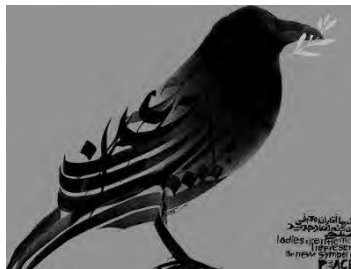
شکل ۸- نمایش ترکیب حروف و تصویر

ایجاد ارتباط متقابل بین حروف و دیگر عناصر کار، به خصوص تصاویر، از جدی ترین مسائل بسیاری از طراحان است. دشواری حل این مساله از کارکردی بودن ناگزیر تایپوگرافی نشات می گیرد. با این وجود، مانند عناصر نقاشی یا مجسمه که برای خلق یک کل با یکدیگر ارتباط متقابل برقرار می کنند، عناصر تایپوگرافی نیز باید با اقلام غیر تایپوگرافی پیرامون خود روابط بصری متحدی را برقرار کنند.