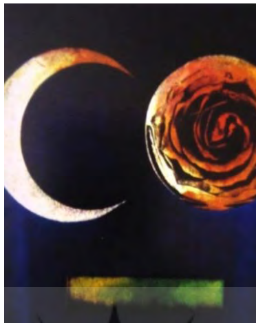
شکل ۱۱- عنصر تعادل در تصویرسازی (می تراود مهتاب)، فرشید مثقالی [۱۲]

تعادل: منظور از تعادل، پراکندگی عادلانه و منطقی اجزای جالب و جذاب تشکیل دهنده ی یک تصویر است. تعادل ممکن است از نوع رسمی یا غیررسمی باشد. در تعادل رسمی، هدف ایجاد اثری ساده، آرام کننده، رسمی، ساکن و کم انرژی است. برای مثال، نمایش چهره ی انسان و جانوران از رو به رو یا پشت سر. در تعادل غیررسمی، هدف ایجاد تحرک، پویایی، به جنبش درآوردن احساسات و ایجاد کنجکاوای ذهنی است. برای مثال، نمایش چهره ی انسان و جانوران از رو به رو یا پشت سر. در تعادل غیررسمی، هدف ایجاد تحرک، پویایی، به جنبش درآوردن احساسات و ایجاد کنجکاوای ذهنی است.