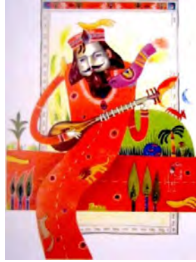
شکل ۷- انتزاع کودکانه در تصویر کتاب (جاده)، نگین احتسابیان