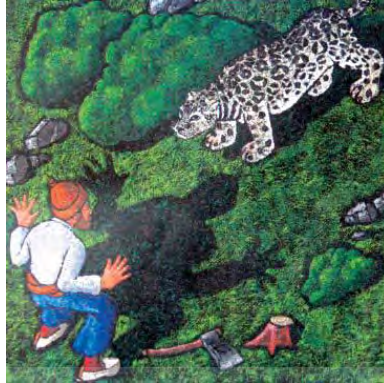
شکل ۱۰- زاویه دید از بالا

کاربرد رنگ در تصویر از نظر پوشش سطحی درونی فرم به گونه های متفاوتی صورت می گیرد که شامل الف) رنگ، بدون استفاده از فرم های خطی، ب) رنگ، در چارچوب فرم، پ) رنگ، بیرون از چارچوب فرم. به کارگیری عناصر دیداری تصویر هم چون: خط، فرم، رنگ و بافت در آفرینش تصویر با ویژگی های ترکیبی همراه است که مجموعه ی آن را «ترکیب بندی» می نامند. ترکیب بندی در یک تصویر مجموعه ای است از عناصر: تضاد (کنتراست)، زاویه دید، تعادل، ضرب آهنگ، هماهنگی، یکپارچگی، تاکید، سفیدخوانی، چینش (همراهی اجزای تصویر، همراهی متن و تصویر). تغییر زاویه دید و نگاه در تصویر سازی می تواند بر گسترش هیجان و پویایی تاثیر گذار باشد [۶].