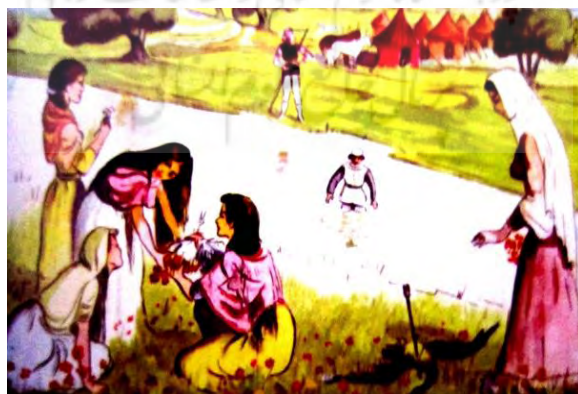
شکل ۹- نخستین نشانه های سایه روشن رنگی در تصویرسازی ایران [۷]

لازم به ذکر است کاربرد رنگ در آثار تصویرسازان، با توجه به مواد به کار گرفته شده، زاویه دید و روش کار، از گوناگونی فراوانی برخوردار است. در اینجا به برخی از ویژگی های کاربرد رنگ در آثار تصویرسازان، مورد گفت و گو قرار می گیرد. گرایش به کاربرد رنگ های تند، خالص، درخشان و یکدست، یادگار تلاش های رنگی هنرمندان گذشته است که هنوز هم نمود هایی از آن در زندگی قبیله ای و در نقش و نگار بخشیدن به چهره، اندام و اشیای پیرامون به چشم می خورد. نقاشان رنگ اندیش امپرسیونیست، به ویژه هنرمندان فوویست در آثار هنری شان، به فراوانی از حضور این گونه رنگ بهره می جستند. استفاده از رنگ های تند، درخشان و غیر ترکیبی در آثار هنرمندانی چون ممیز از جمله در کتاب حقیقت و مرد دانا و بهمن دادخواه در کتاب شعرهایی از شاعران ایران، دیده می شود. استفاده از این گونه رنگ، بیشتر مناسب خردسال سال های اول دبستان است [۸].