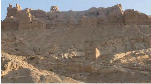
تصویر (۵): نمایی از قلعه آتشگاه

حمزه در کتاب اصفهان: «این کوه را که اکنون آتشگاه خوانند از جمله بیوت عبادات بوده است و در عهد طهمورث، و آن را مینوذر خواندند و بتان نهاده بودند بسیار.