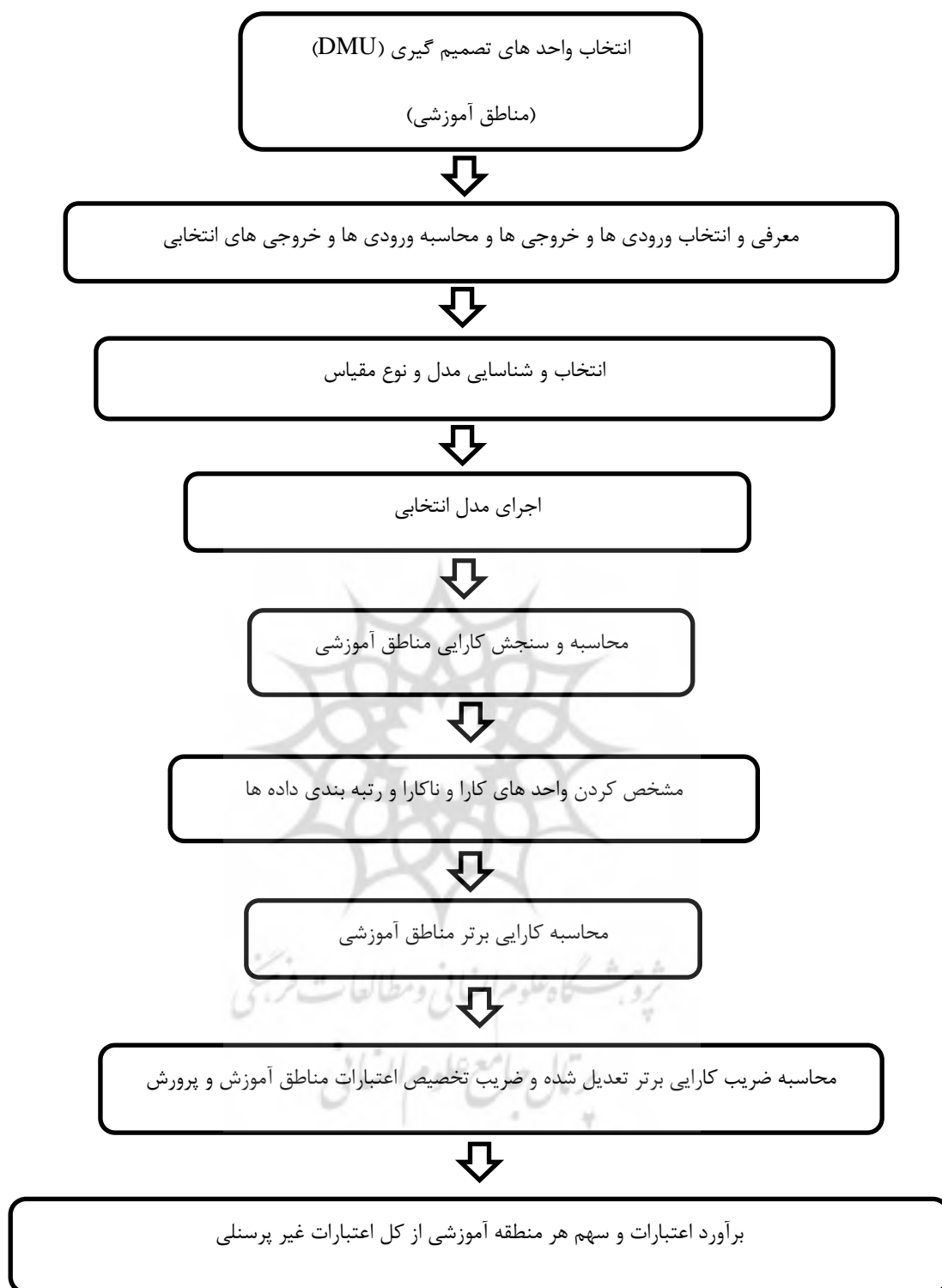
شکل ۲ - الگوی عملیاتی تخصیص اعتبارات بر اساس رویکرد کارایی