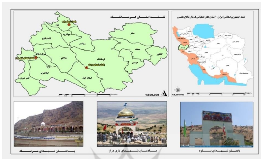
شکل ۲: موقعیت نسبی استان کرمانشاه و یادمان‌های مورد مطالعه

سوالات و پرسش نامه‌های مشابه در کتاب‌ها و مقالات و همچنین تایید متخصصان دانشگاهی عرصه گردشگری و توزیع ۶۰ پرسشنامه به‌عنوان پیش آزمون و پایایی آن نیز با محاسبه ضریب آلفای کرونباخ برابر ۰.۸۳۹ مورد تایید قرار گرفتند. در