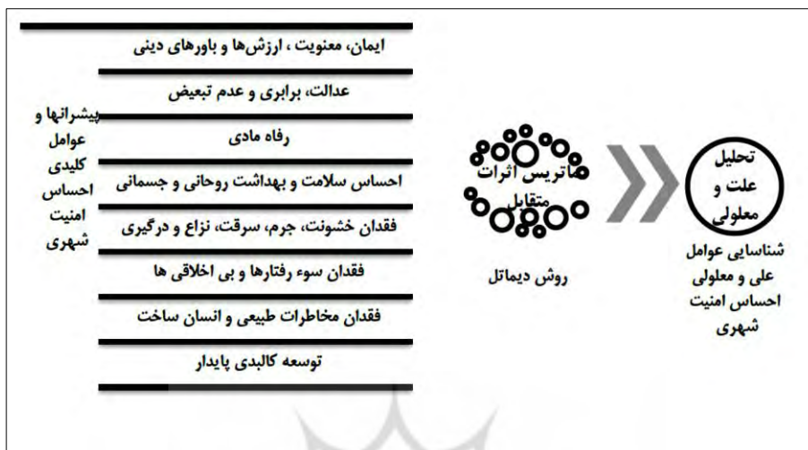
شکل ۱: مدل مفهومی تحقیق