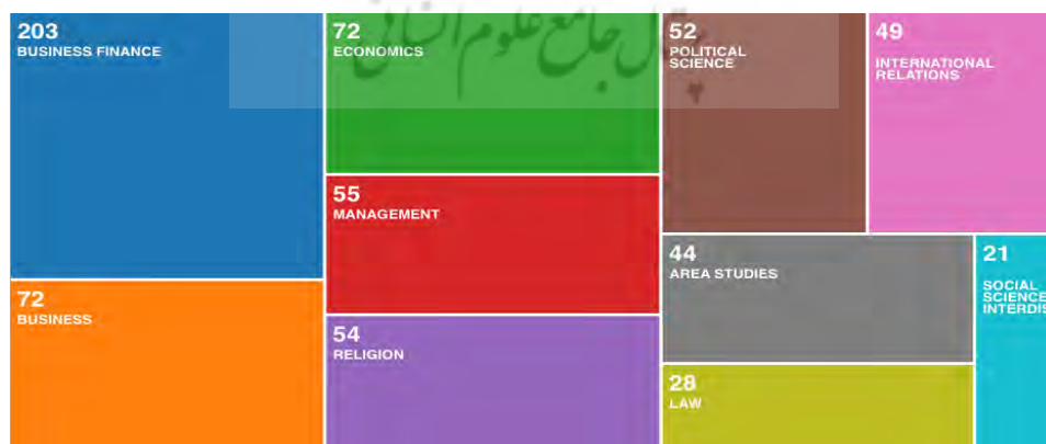
شکل ۱: تولید علمی حکمرانی اسلامی در جهان براساس تفکیک رشته

از جدول (۱) می‌توان دریافت که بیشترین تعداد (۲۰۳) و بیشترین درصد (۲۹/۸۹۷ درصد) از تولیدات علمی جهان در رشته‌های مختلف براساس پایگاه (WOS) مربوط به رشته‌ی سرمایه‌گذاری کسب‌وکار است و کمترین آن مربوط به رشته‌ی علوم اجتماعی بین‌رشته‌ای با تعداد ۲۱ و ۳/۰۹۳ درصد می‌باشد. شکل (۱) به‌صورت گرافیکی این یافته‌ها را نشان می‌دهد.