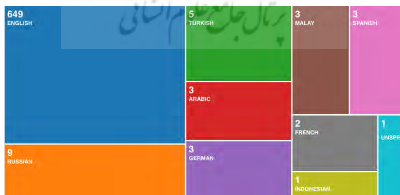
شکل ۲: تولید علمی حکمرانی اسلامی در جهان براساس تفکیک نوع زبان

از جدول (۲) می‌توان دریافت که بیشترین تعداد (۶۴۹) و بیشترین درصد (۹۵/۵۸۲ درصد) از تولیدات علمی حکمرانی اسلامی در جهان برحسب نوع زبان مربوط به زبان انگلیسی است و همچنین می‌توان دریافت که کمترین تعداد (۱) مربوط به زبان اندونزیایی و دیگر زبان‌های ناشناخته یا محلی با سهم ۰/۱۴۷ درصدی می‌باشد. شکل (۲) به‌صورت گرافیکی این یافته‌ها را نشان می‌دهد.