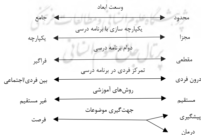
شکل ۲ ابعاد برنامه آموزشی برای آموزش اخلاق

روش‌های آموزشی هم می‌تواند مستقیم و هم غیرمستقیم باشد. روش‌های مستقیم به فعالیت‌ها و راهبردهای خاصی گفته می‌شود که برای استفاده در طول آموزش برنامه‌ریزی شده است (از قبیل، ایفای نقش، تمرین ساخت مهارت، شاگردی عاطفی، شاگردی برای مراقبت، آموزش و پرورش دینی و غیره). روش‌های غیرمستقیم به مداخله‌هایی با بروندهای طراحی شده‌ای ارجاع می‌یابد که لزوماً در کلاس درس صورت نمی‌گیرد. این مداخله‌ها می‌تواند شامل الگوبرداری، تغییر در جو کلاس درس، حمایت اجتماعی، کلاس درس صلح‌جو، جامعه عادل و غیره باشد.