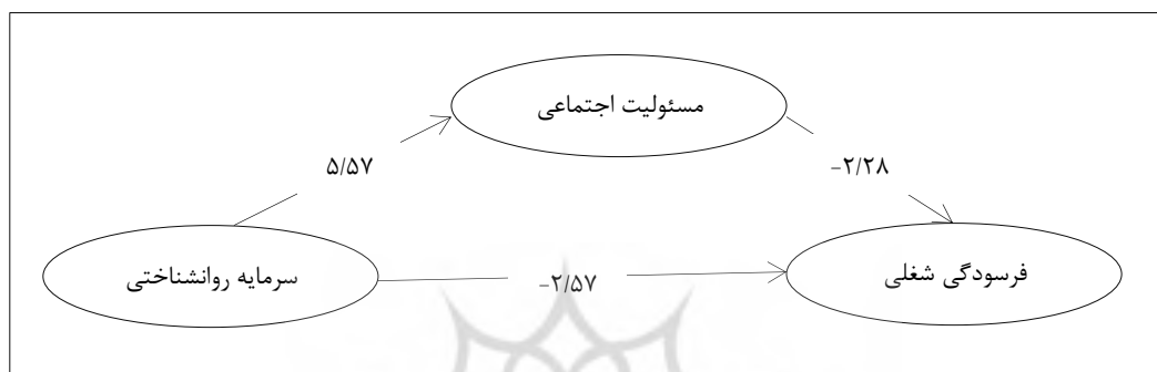
شکل ۲. مدل برازش شده سرمایه روانشناختی و فرسودگی شغلی با میانجی‌گری ادراک مسئولیت اجتماعی پرستاران در حالت آزمون‌تی