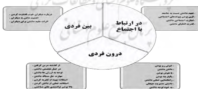
نمودار ۳. ویژگی‌های انسان خردمند در دستاوردهای روان‌شناسی

در نمودار ۳، تبیین ویژگی‌های انسان خردمند در دستاوردهای روان‌شناسی آمده است.