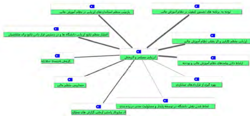
شکل ۳: زیرمؤلفه‌های ارزیابی مستمر و اثربخش (عملکرد دانشگاه، امور مالی و انتصابات دانشگاهی)، (قطر خطوط نشان دهنده میزان ارجاع است)

مسئولیت پذیری مدنی و توسعه پایدار: در سده اخیر دانشگاه‌ها و مراکز آموزش عالی به عنوان یک سازمان در توسعه ملی نقش مهمی داشته‌اند. به همین اندازه مسئولیت اجتماعی دانشگاه در چند دهه اخیر با توجه به رشد تعداد دانشجویان و همگانی شدن آن و بالا رفتن انتظار دانشگاه در قبال جامعه، مورد توجه برنامه‌ریزان آموزشی در کشورهای مختلف قرار گرفته و نظام آموزش عالی بسیاری از کشورها یکسری از فعالیت‌ها و برنامه‌های شغلی و حرفه‌ای را در اجتماع دانشگاهی گسترش داده‌اند.