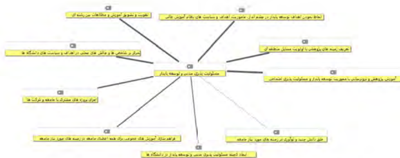
شکل ۴: زیرمؤلفه‌های مسئولیت‌پذیری مدنی و توسعه پایدار (قطر خطوط نشان‌دهنده میزان ارجاع است)

بنابراین، در این پژوهش یکی از مؤلفه‌های حکمرانی خوب که از نظرات صاحب‌نظران استخراج شد، مؤلفه مسئولیت‌پذیری مدنی و توسعه پایدار بود که از میان زیر مؤلفه‌های این مؤلفه اصلی، آموزش، پژوهش و برون‌رسانی با محوریت توسعه پایدار و مسئولیت‌پذیری اجتماعی، لحاظ کردن اهداف توسعه پایدار در چشم‌انداز، مأموریت، اهداف و سیاست‌های نظام آموزش عالی و تعریف زمینه‌های پژوهشی با اولویت مسائل منطقه‌ای بیشترین ارجاع را به خود اختصاص دادند.