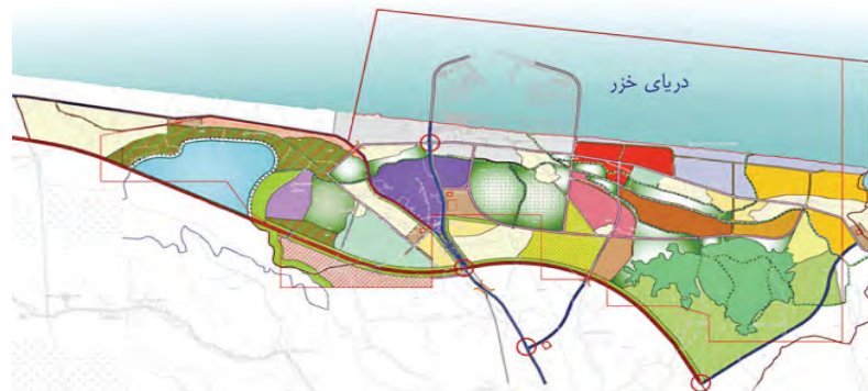
شکل ۱. موقعیت مکانی منطقه آزاد انزلی بر روی نقشه منبع: بقایی (۱۳۸۹: ۱۰)

۳۷ درجه و ۲۷ دقیقه عرض شمالی از خط استوا و ۴۹ درجه و ۳۳ دقیقه تا ۴۹ درجه و ۴۴ دقیقه طول شرقی از مبدأ نصف النهار گرینویچ قرار گرفته است که موقعیت مکانی آن در شکل ۱ نمایش داده شده است.