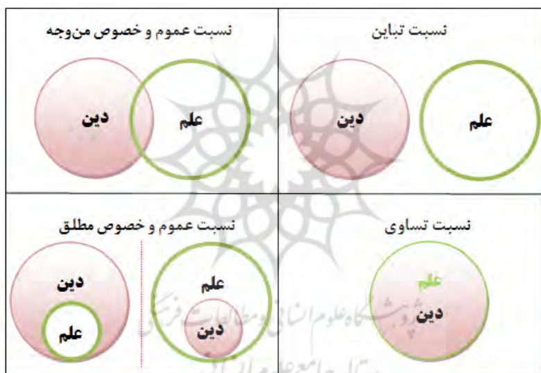
شکل ۲: نسبت‌های علم و دین در رهیافت‌های نظری مختلف

نهاد علم نیز از این راهبرد و رهیافت اساسی برکنار نیست و در هر مرحله‌ای بایستی خود را دوباره سامان‌دهی و همراه سازد. به همین جهت در تمامی اسناد بالادستی ناظر بر نهاد علم، آشکارا یا تلویحی، دلالتی بر بایستگی چنین ارتباطی مشاهده می‌شود. به‌طور کلی برای ارتباطات نهاد علم و دین بر اساس احتمالات منطق صوری، چهار صورت قابل تصور و ترسیم است که در شکل شماره ۱ درج شده است.