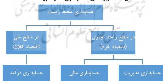
شکل ۱ - کاربردهای حسابداری محیط زیست