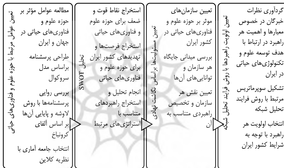
شکل ۲. نمایی از مراحل پژوهش

نتایج نهایی براساس روش فرایند تحلیل شبکه تجزیه و تحلیل شد. دلیل استفاده از روش تحلیل شبکه وجود عوامل اثرگذار مختلف و اثرات متفاوت این عوامل بر توسعه علوم و فناوری‌های حیاتی کشور ایران بود. بنابراین، پژوهش حاضر از نظر پارادایم به حالت تفسیری، نوع هدف پژوهش کاربردی، از نظر روش پژوهش توصیفی یا غیر آزمایشگاهی و از نظر رویکرد به صورت کمی و کیفی (ترکیبی) است. روش پژوهش موردنظر در این مطالعه، روش کتابخانه‌ای، تفسیری و تحلیلی می‌باشد. برای این منظور تمامی داده‌ها از طریق مطالعه کتاب‌ها و مقالات علمی، صنعتی و تجاری موجود به صورت فارسی، انگلیسی و همچنین تارنماهای مرتبط، در جهت توسعه علوم و فناوری‌های حیاتی موردنظر، گردآوری و طبقه‌بندی شد؛ بنابراین مقاله حاضر کلی‌نگر است. همچنین براساس پرسشنامه‌های طراحی شده در این مقاله، نظرات خبرگان در مورد سؤالات طراحی شده به دست آمده است. پس در این مقاله علاوه بر مطالعات کتابخانه‌ای و اینترنتی، از پژوهش‌ها میدانی نیز استفاده شده است. تمرکز پژوهش‌ها میدانی استفاده شده در این مقاله بر شناسایی وضع موجود علوم حیاتی در ایران با استفاده از پرسش‌نامه، مصاحبه و تحلیل محتواست. بر این اساس مراحل استفاده شده در این پژوهش در شکل ۲ ارائه می‌شود.