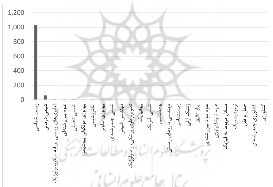
شکل ۱. حوزه‌های مورد بررسی در حوزه علوم و فناوری‌های حیاتی بین سال‌های ۱۹۶۵ تا ۲۰۲۱ در کشور ایران [۴۳، ۴۴]

براساس نتایج به‌دست‌آمده از بررسی پایگاه علمی گوگل اسکالر ۱۲ بین سال‌های ۱۹۶۵ تا ۲۰۲۱ در مورد کشور ایران می‌توان چنین گفت که مهم‌ترین حوزه‌های فعال و مرتبط با این علوم در ایران به ترتیب زیست‌شناسی، شیمی‌درمانی، فناوری‌های زیستی بر پایه میکروبیولوژیک، علوم بین‌رشته‌ای، شیمی تحلیلی، بیولوژی مولکولی بیوشیمی، الکتروشیمی، بیولوژی سلولی، شیمی بین‌رشته‌ای، مهندسی شیمی، تصویربرداری پزشکی (رادیولوژی)، بیوفیزیک، شیمی فیزیک، بوم‌شناسی، مهندسی داروهای زیستی، زیست‌شناسی، ژنتیک ارثی، ابزار دقیق، علوم مواد بین‌رشته‌ای، علوم نانو تکنولوژی، مسائل مربوط به فیزیک، ترمودینامیک، حمل‌ونقل و مهندسی کشاورزی هستند که متأسفانه از نظر تمرکز و میزان خروجی‌های علمی به‌صورت کاملاً نامتوازن مورد توجه قرار گرفته‌اند، به طوری که اولین حوزه یعنی زیست‌شناسی بیش از ۹۰٪ پروژه‌ها و اسناد علمی را به خود اختصاص داده است و دومین حوزه کمتر از ۵٪ منابع را در اختصاص دارد. این عدم توازن می‌تواند به شدت وضعیت ایران را مورد تهدید و آسیب قرار دهد [۲] و [۲۲]. این موضوع در شکل ۱ نشان داده شده است.