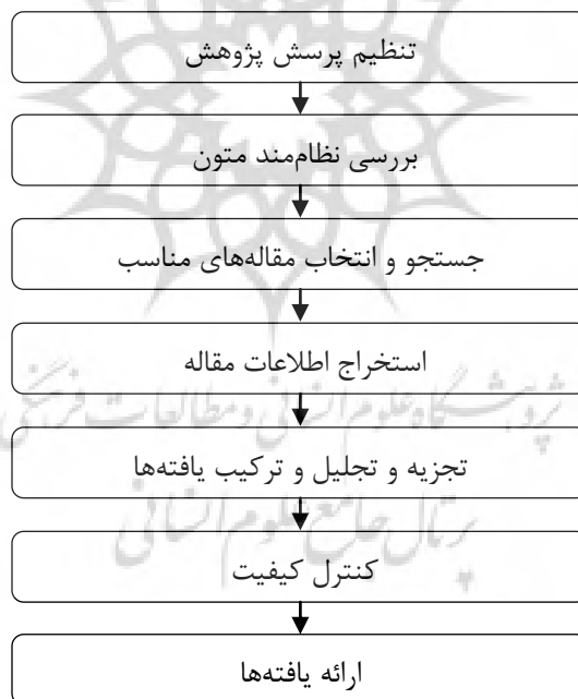
شکل شماره ۱: مراحل هفت‌گانه پژوهش

در پاسخ به سؤال اول پژوهش مبنی بر شناسایی عوامل مؤثر بر کارآفرینی اجتماعی زنان حاشیه‌نشین شهر زاهدان از روش فراترکیب جهت پاسخ به سؤال استفاده شده است که در ادامه گام‌های این روش و یافته‌های آن‌ها شرح داده شده است. بنا به تعریف زیمر ۱ (۲۰۰۶)، فراترکیب نوعی مطالعه‌ی کیفی می‌باشد که اطلاعات و یافته‌های استخراج‌شده از مطالعات کیفی دیگر با موضوع مرتبط و مشابه را بررسی می‌کند (Manian & Ronaghi, 2015). فراترکیب با فراهم کردن نگرش نظام‌مند برای پژوهشگران از راه ترکیب پژوهش‌های کیفی گوناگون به کشف موضوعات و استعاره‌های جدید و اساسی می‌پردازد و با این روش، دانش جاری را ارتقا داده، دیدی جامع و گسترده را درباره‌ی مسائل پدید می‌آورد (Ronaghi, M., Dehghani, 2021: 51). در این تحقیق از مراحل هفت‌گانه سندلوسکی و بارسو ۲ (۲۰۰۳) انجام شده و در شکل شماره یک نشان داده شده است جهت دستیابی به اهداف تحقیق استفاده شده است.