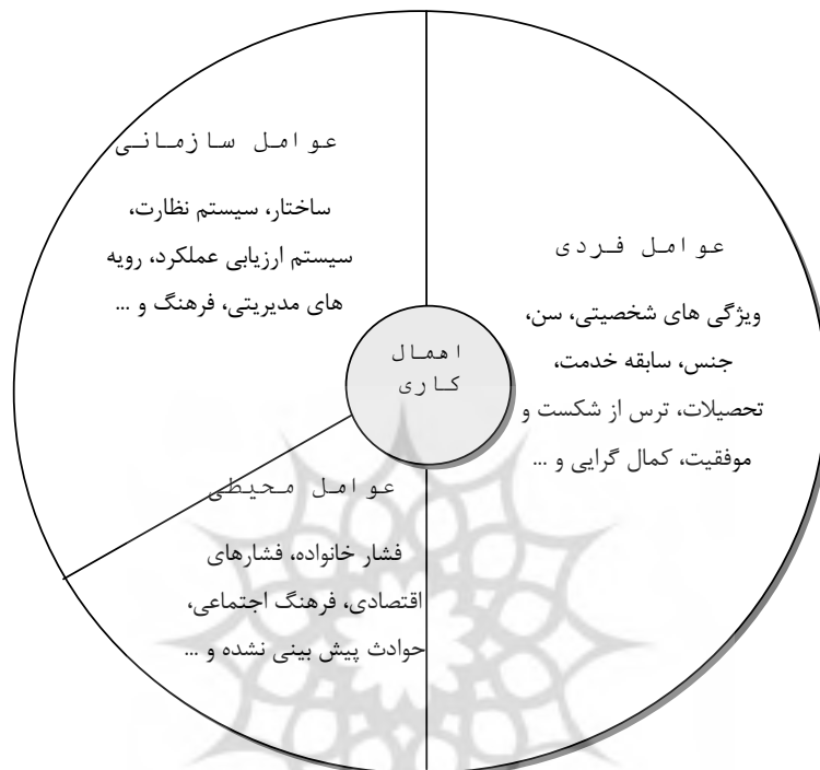
شکل (۱): عوامل مؤثر بر اهمال کاری

پژوهش کاظمی و همکاران (۱۳۸۹) نام برد. آنان عوامل مؤثر بر اهمال کاری را بر اساس تحقیقات قبلی و عوامل احتمالی در نظر گرفته نشده، استخراج و پس از اجماع صاحب نظران در قالب سه دسته عوامل فردی، محیطی و سازمانی طبقه‌بندی کردند (شکل ۱). قطعاً وزن و میزان تأثیر این عوامل در ایجاد و ادامه اهمال کاری یکسان نیست. آنها در این مدل با توجه به پیش‌زمینه محققان در خصوص تأثیر عوامل فردی، تأثیر عوامل فردی را بیشتر از سایر عوامل در نظر گرفتند.