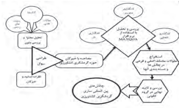
شکل ۱: مدل اجرایی تحقیق

روش گردآوری و تحلیل اطلاعات در این پژوهش در سه مرحله صورت گرفت. ابتدا مطالعه کتابخانه‌ای از طریق حضور در کتابخانه‌ها برای مطالعه یادداشت‌برداری از کتاب‌ها و مقالات معتبر فارسی و لاتین انجام شد. ابزار گردآوری اطلاعات برای این منظور استفاده از فیش‌های کامپیوتری بود. دوم، مصاحبه با خبرگان حوزه کسب‌وکار و گردشگری که پس از انجام و ضبط مصاحبه‌ها، متن مصاحبه‌ها پیاده‌سازی و با استفاده از نسخه ۲۰۱۸/۲ نرم‌افزار مکس کیودا کدگذاری اولیه و محوری شد و سپس به انتخاب مفاهیم، تکوین متون و مقوله‌ها و همچنین استخراج نتایج اقدام شد و در نهایت نیز، گروه کانویپ برای سنجش اعتبار (روایی) و پایایی پژوهش از روش ارزیابی لینکولن و گوبا تشکیل شد. برای نیل به اعتبارپذیری، از دو راهبرد مثلث‌سازی ۱ و بررسی در گروه کانونی ۲ (خبرگان حوزه‌های گردشگری، کارآفرینی، کشاورزی) استفاده شد و اعتبار یافته‌ها و