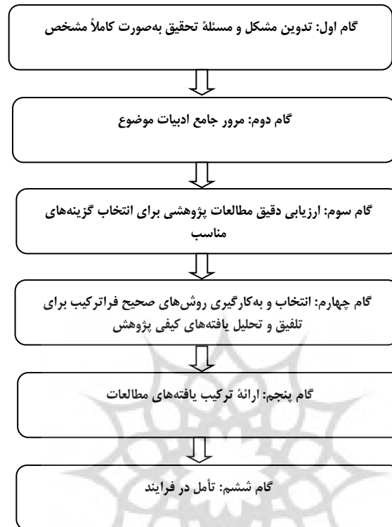
نمودار ۱: فرایند شش مرحله‌ای اجرای فراترکیب (Erwin et al., 2011)

کاتالانو، ۱ (۲۰۱۳). در این پژوهش از روش شش مرحله‌ای اروین و همکاران (2011) برای اجرای فراترکیب (نمودار ۱)، استفاده شده است.