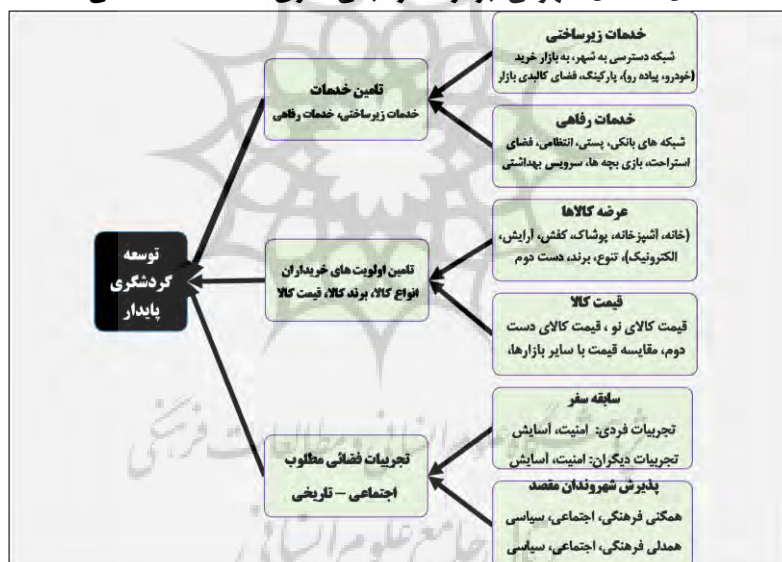
شکل ۱: مدل مفهومی؛ برگرفته از مبانی نظری، مطالعات اکتشافی

فرهنگ خرید لوکس و تکامل شرکت‌های لوکس و مد را تحلیل کردند و بر راهبردهای برندسازی، عملکرد خرده فروشی و نقش فروشگاه‌های پرچم‌دار مد و لوکس تأکید نمودند. چویی و همکاران (2018) در پژوهشی (به روش شوارتز ۱ )، گونه‌شناسی گردشگران خرید در چین را تحلیل کردند و راهکارهای مناسب برای سازمان‌های بازاریابی مقصد، به منظور ایجاد راهبردهای تدارک زمینه و خدمات بهتر خرید و جلب رضایت گردشگران ارائه کردند. جو و همکاران (2018) نگرش ساکنان به گردشگران داخلی را تحلیل کردند و نشان دادند که فراوانی تعامل میان گردشگران داخلی ساکنان بر افزایش همبستگی عاطفی و کاهش فاصله اجتماعی مؤثر است. بیات و همکاران (۱۳۹۶) نگرش ساکنان را دستاوردهای حضور گردشگران تحلیل کردند و دریافتند که طبق نظریه مبادله اجتماعی، سه دیدگاه با تفاوت معنی‌دار میان ادراکات مردم از تأثیرات گردشگری وجود دارد. هانگ و همکاران (2018) به جایگاه دبی در گردشگری خرید، ترجیحات گردشگران در انتخاب مقصد، اهمیت یک محل خرید لوکس و همچنین توسعه آن پرداختند. چویی و همکاران (۲۰۱۵: ۱۴۱) بر تأثیر استراتژی‌های خلاقانه مقصد، محیط خرید و خدمات روی سطح رضایت گردشگران تأکید نمودند. یافته‌ها نشان می‌دهد که تجربه لذت بخش و خاطره‌ای به یادماندنی به وفاداری گردشگر به مقصد منجر خواهد شد (رضوانی، ۱۳۹۲: ۱۹۵-۱۹۸).