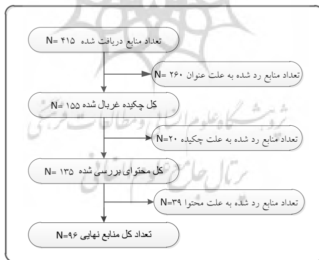
شکل ۱: مراحل و تعداد منابع بررسی شده در فراترکیب

نخستین گام شناسایی متغیرهای اصلی است. استخراج اطلاعات با روش فراترکیب و با کدگذاری باز (۱۳۵۰ کد) و محتوایی (۴۵ کد) انجام پذیرفته که در قالب شانزده مقوله اصلی قرار گرفته است. این مقوله‌ها نیز به صورت پنج موضوع اصلی دسته‌بندی شده‌اند.