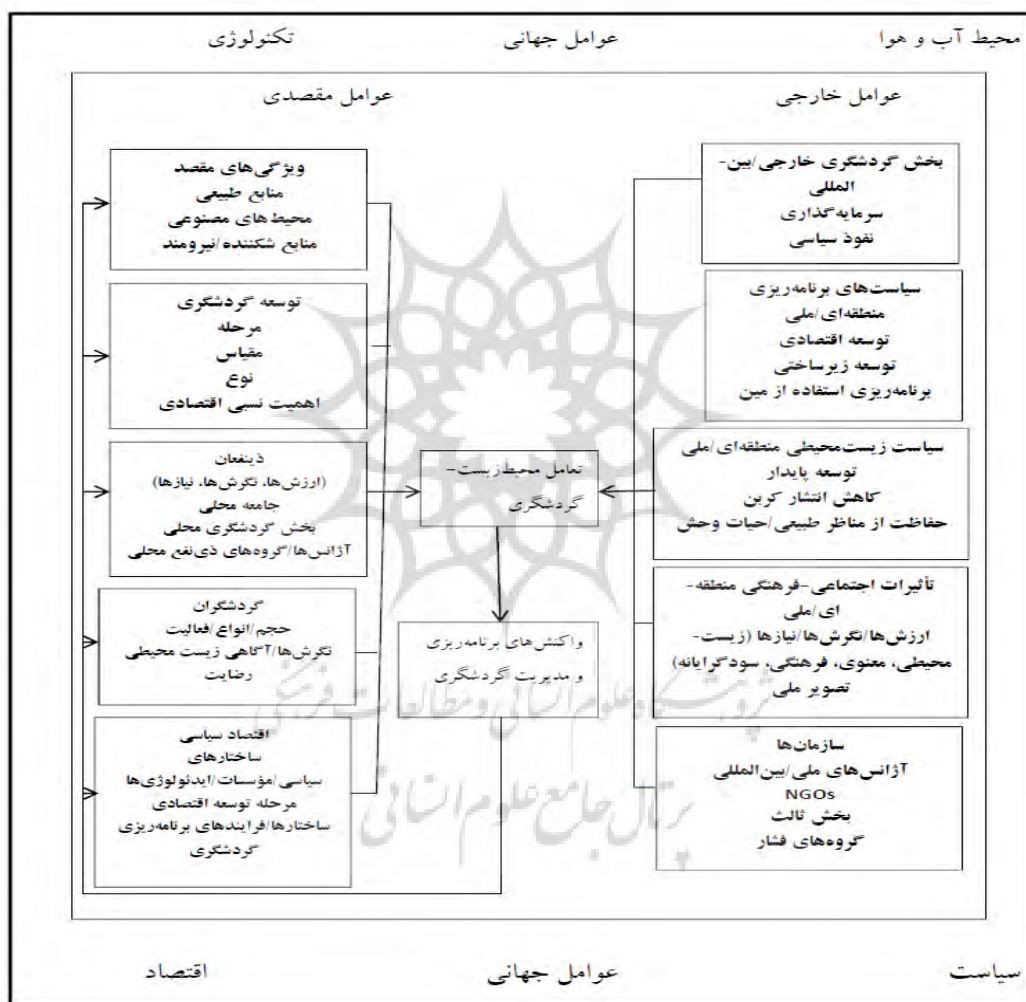
شکل ۱: مدل مفهومی تعامل گردشگری - محیط‌زیست (رمضان نژاد و پورقیومی، ۱۳۸۵، ص ۱۹۲)

شکل ۱ نشان می‌دهد که سه لایه یا سطح وجود دارد که بر این رابطه تأثیر می‌گذارد. در نتیجه باید مدیریت محیط‌زیست‌های گردشگری مهم تلقی شود. البته در ابتدا ضروری است که تحلیلی از همپوشی بین گردشگری و محیط‌زیست در بافت مقصد در نظر گرفته شود: محیط‌زیست مقصد معمولاً یکی از عناصر مهم محصولات و تجارب گردشگری است و باید به‌گونه‌ای مدیریت شود که نه تنها نیازها و انتظارات گردشگر برآورده شود، بلکه در آینده جاذب گردشگران باشد. در عین حال، کاربرد و مدیریت محیط‌زیست مقصد باید تا حد امکان بازتاب‌دهنده نیازهای جوامع محلی باشد و باعث افزایش منافع و برآورده شدن نیازهای آنان شود (همان‌جا).