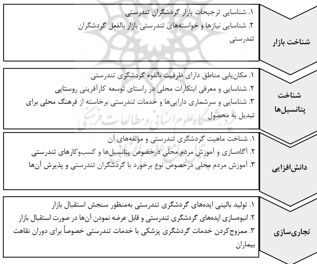
شکل ۲: فرایند شناسایی و تجاری‌سازی فرصت‌های کارآفرینی گردشگری تندرستی به‌عنوان هسته مرکزی مدل

با این حال، همان طور که شرح داده شد، بهره‌گیری از پتانسیل‌های سرشار کشور، در جهت توسعه کسب‌وکارهای گردشگری تندرستی، مستلزم طی کردن مراحل است که در قالب مقوله‌ای تحت عنوان «فرایند شناسایی و تجاری‌سازی» در بطن مدل نهایی پژوهش جای گرفته است. اگرچه مقوله مزبور ابعاد زیادی را مبتنی بر یافته‌های حاصل از مصاحبه‌ها دربر می‌گیرد، بنابر دانش و مطالعات و تجارب پژوهشگران در این پژوهش، غربال این ابعاد در نهایت مدلی را ارائه نمود که مراحل چهارگانه آن هرکدام شامل سه راهبرد کلی می‌شود که در شکل ۲ به‌وضوح ارائه شده است. در پیروی از دو مرحله آخر، توجه به این نکته ضروری است که مهم‌ترین پیش‌نیاز برای تجاری‌سازی پایدار خدمات گردشگری تندرستی در کشور جدی‌گرفتن این خدمات و تفریحی تلقی نکردن آن است؛ امری که در حوزه‌های یادشده، به‌خصوص در رابطه با جنگل‌ها، چشمه‌های آب‌گرم و معدنی، نواحی بیابانی و غارهای نمک موجود در کشور، از نگاه دست‌اندرکاران و فعالان گردشگری به‌طور کلی مغفول مانده و عواقب جبران‌ناپذیری را در پی خواهد داشت. حال آن‌که بهره‌گیری از این پتانسیل‌های سرشار در جهت توسعه گردشگری تندرستی، به‌واسطه تطبیق تبعات صنعت گردشگری تندرستی با موازین زیست‌محیطی، در کاهش تأثیرات منفی مذکور بسیار مؤثر خواهد بود.