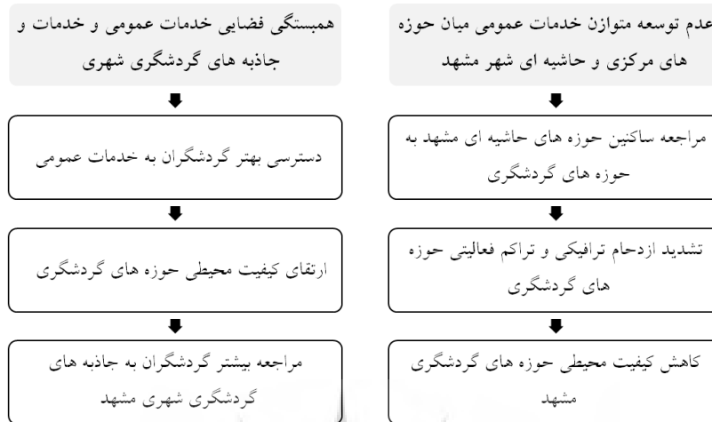
شکل ۴: آثار ناشی از توسعه خدمات عمومی در حوزه‌های مرکزی مشهد

به حوزه‌های مرکزی مشهد می‌شود. این مراجعه تراکم فعالیت و ازدحام ترافیک را در حوزه‌های گردشگری تشدید می‌کند و به کاهش کیفیت محیطی حوزه‌های گردشگری مشهد منجر می‌شود.