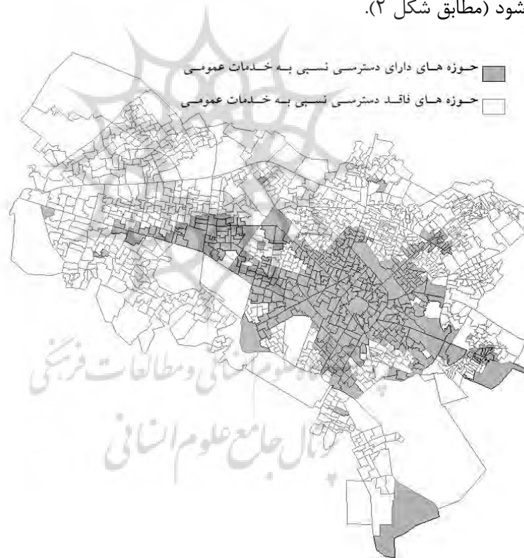
شکل ۲: خوشه‌بندی حوزه‌های آماری مبتنی بر دسترسی نسبی به خدمات عمومی

بعد از تعیین عضویت حوزه‌های آماری در هر یک از طبقات، نتایج تحلیل خوشه‌ای به نرم‌افزار ArcGIS منتقل می‌شود. در این نرم‌افزار، امکان ترسیم پراکنش فضایی حوزه‌های آماری در دو طبقه مجزا فراهم می‌شود (مطابق شکل ۲).