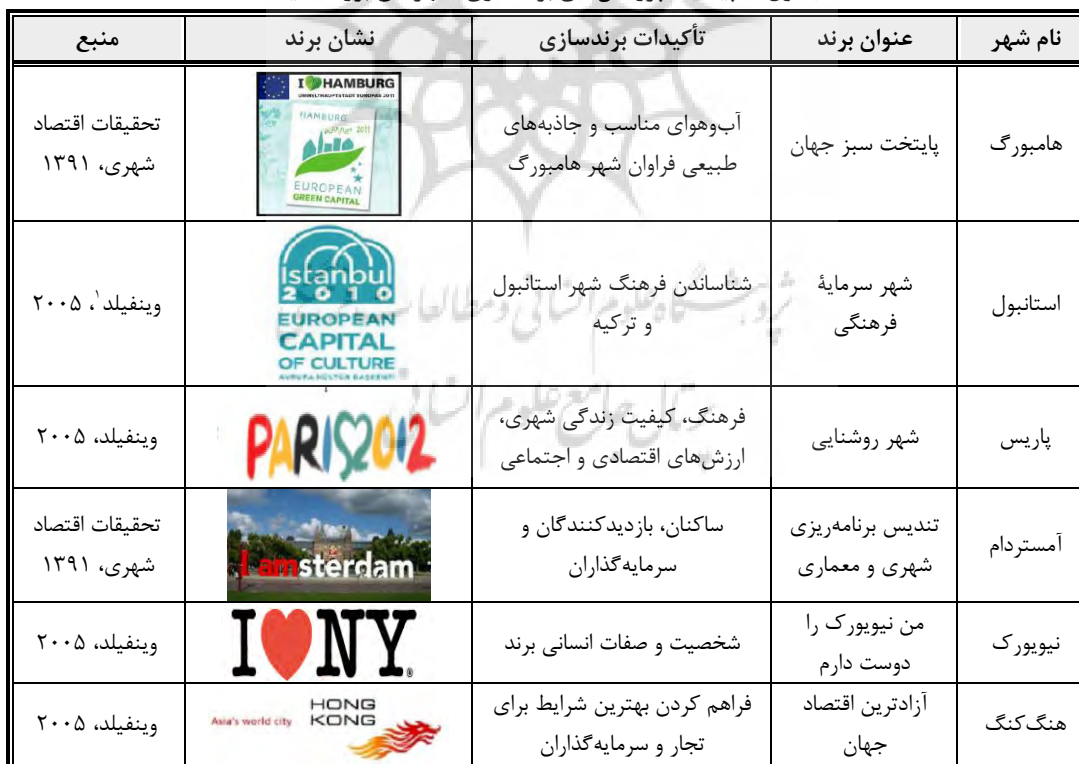
جدول ۲: پیشینه پژوهش‌های برندسازی: شهرهای بزرگ دنیا

اما درخصوص پژوهش‌های خارجی باید گفت، درخصوص برندسازی شهری پژوهش‌های کاربردی انجام شده که در جدول ۲ شرح کامل آن‌ها، با توجه به نشان برند شهرهای مهم، نشان داده شده است.