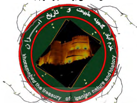
شکل ۱: نشان برند شهر خرم‌آباد

برند اهمیت بسیاری دارد. در پژوهش حاضر، پس از گزینش و ارائه عنوان برند شهر خرم‌آباد، با استفاده از نظر متخصصان حوزه بازاریابی و طراحی لوگو، نشان شهر خرم‌آباد ارائه شده است (شکل ۱). در ارائه نشان برند حاضر سعی شده هویت طبیعی و تاریخی شهر خرم‌آباد، که در مراحل قبلی پژوهش تشریح شده، نمود یابد.