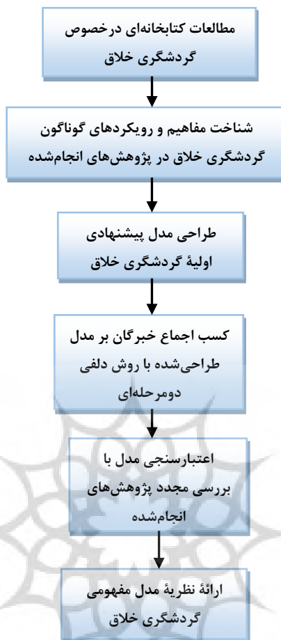
شکل ۱: مدل اجرایی پژوهش