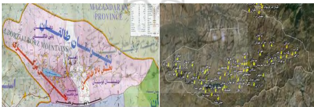
تصویر ۱: نواحی روستایی مورد مطالعه در شهر طالقان

روش پژوهش حاضر توصیفی-تحلیلی است و متکی بر بفرایند ترکیب روش‌ها است. منطقه مورد مطالعه در این تحقیق روستاهای هدف گردشگری شهرستان طالقان می‌باشند. طالقان منطقه ییلاقی در میان کوه‌های برفگیر البرز، از غرب کندوان، تا ۴۰ کیلومتری شرق قزوین گسترده شده است. یکی از بخش‌های شهرستان ساوجبلاغ از توابع استان تهران می‌باشد که در ۱۳۰ کیلومتری شمال غرب تهران واقع شده از شمال به سلسله جبال البرز و رامسر و تنکابن و الموت، از شرق به شهرستان کرج، از جنوب به هشتگرد و ساوجبلاغ از غرب و جنوب غربی به قزوین محدود می‌گردد. روستاهای مورد مطالعه شامل ۱۱ روستا، (بجز، دیزان، فشندک، گلیرد، گوران، حسن جون، جوستان، کرکبود، سوهان، وشته، زیدشت)، در شهرستان طالقان می‌باشند و مجموع جمعیت آن‌ها، ۶۵۹۰ نفر می‌باشد جامعه آماری پژوهش حاضر شامل شوراهای ۱۱ روستای شهر طالقان می‌باشد.