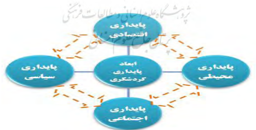
شکل ۲: ابعاد پایداری گردشگری، (منبع: نگارندگان)

گردشگری روستایی به عنوان شکلی نوین از مبحث گردشگری با هدف توسعه محلی یکی از مهم‌ترین مشاغل روستایی به شمار می‌رود (Walpole & Goodwin, 2000,5). تا محیط‌های روستایی را از انزوا و مهجوریت به درآورده و علاوه بر توسعه اقتصادی و رویکرد صرفاً اقتصاد محور و تک بعدی به گردشگری به سمت رویکرد اجتماع محور نیز سوق یابد و راه حل تعدادی از مشکلاتی که مناطق روستایی با آن‌ها مواجهند، شود (Kinsmon, 1996, 35). از بین رفتن منابع آبی روستایی، سرازیر شدن جمعیت به شهرها و ضرورت داشتن تنوع اقتصادی در بسیاری از کشورها منجر به کاربست شیوه‌های جدیدی برای توسعه گردیده که یکی از آن‌ها توسعه گردشگری می‌باشد (Holland, 1992, 63) و البته شالوده این امر نیز همراهی روستاییان و رخنمون یافتن در بطن فرهنگ آنان و راه یافتن به اندیشگی نهادینه شده در پروسه هزاره‌ها می‌باشد. در این فراشد تعمیق در باورداشت ساکنان روستا برای دست‌یابی به پایداری اجتماعی و فرهنگی و کشف چگونگی نضج روابط درونی روستاییان بمنظور شکل‌پذیری عینت جغرافیایی بسیار حائز اهمیت است و در نتیجه این امر به تسهیل احیاء و نوسازی روستاهای کشور و بافت با ارزش روستایی می‌انجامد (رضوانی، ۱۳۷۰: ۴۸). این فراگرد پایداری را منوط به اصولی می‌پندارد که برای کاهش فقر روستایی، برابری بین نسلی و میان نسلی، تنوع زیستی و ... رعایت آن‌ها الزامی است که ابعاد اصلی آن در زیر آورده شده است (Van der, 2005: 107). (شکل: ۲).