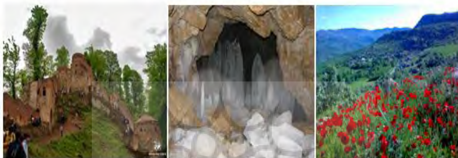
تصویر ۱: جاذبه‌های گردشگری روستاهای طالقان

شهرستان طالقان در استان البرز با دارا بودن روستاهای هدف گردشگری آثار و جاذبه‌ها بی‌نظیری را در خود جایی داده‌اند، که می‌تواند به عنوان یکی از قطب‌های نمونه گردشگری در سطح منطقه معرفی شود. بنابراین در راستای دستیابی به این هدف، پژوهش حاضر بر آن است که تا به بررسی و ارزیابی شاخص‌های پایداری گردشگری با استفاده از روش‌های تصمیم‌گیری چند معیاره و نظرسنجی از شوراهای و ساکنین ۱۱ روستای هدف گردشگری در سطح منطقه مورد مطالعه بپردازد و در نهایت عواملی مهمی که در سطح منطقه مورد مطالعه بایستی جهت توسعه پایدار گردشگری به آن توجه شود، را شناسایی کند.