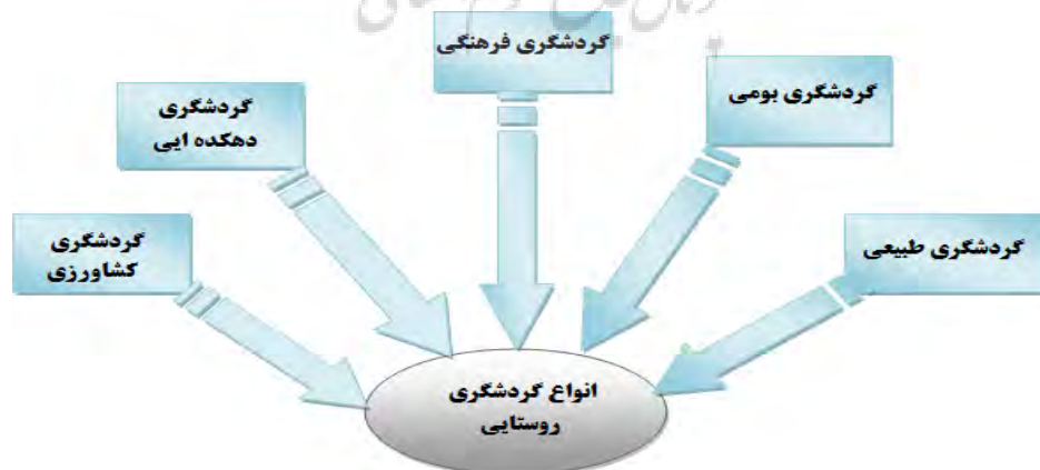
شکل ۱: گونه‌های گردشگری روستایی، (منبع: نگارندگان)

توجه به موضوع گردشگری روستایی از دهه ۱۹۵۰ میلادی گسترش یافت و از دهه‌های ۶۰ و ۷۰ میلادی بیشتر در زمینه اقتصاد گردشگری روستایی برای کشاورزان و جوامع محلی مورد توجه قرار گرفت (قادری، ۱۳۸۲: ۱۲۶). بنابراین گردشگری روستایی از جنبه‌های زیادی بعنوان یک فعالیت گسترده جهانی و نقشی که بر توسعه سیاست‌های منطقه‌ای و محلی دارد، دارای اهمیت است (رحیمی، ۱۳۸۱: ۲۲۶). این نوع از گردشگری می‌تواند به کلیه فعالیت‌ها و خدمات اطلاق شود که به وسیله کشاورزان، مردم، دولت‌ها برای تفریح استراحت و جذب گردشگر در نواحی روستایی صورت می‌گیرد و می‌تواند شامل گونه‌های متفاوتی اعم از گردشگری کشاورزی، طبیعی، فرهنگی و مزرعه باشد (شکل: ۱). هر کدام از گونه‌های گردشگری مطرح شده، بر بعد خاصی از گردشگری روستایی اشاره دارد؛ به عنوان مثال، گردشگری طبیعی عمدتاً بر جاذبه‌های اکولوژیکی تاکید دارد، گردشگری فرهنگی، نیز مرتبط با فرهنگ، تاریخ، میراث باستانی مردم روستایی است و گردشگری بومی، علاوه بر تعامل با جاذبه‌های طبیعی؛ با زندگی و هنرهای اجتماعی مردم روستا در ارتباط است. در گردشگری دهکده‌ای نیز، گردشگران درخانوارهای دهکده زندگی کرده و درفعالیت‌های اقتصادی و اجتماعی روستاییان شرکت می‌جویند و در نهایت گردشگری کشاورزی، بدون لحاظ پیامدهای منفی گردشگران روی اکوسیستم منطقه میزبان، با فعالیت‌های سنتی کشاورزی در تعامل می‌باشند (اشتری مهرجردی، ۱۳۸۳: ۷۴).