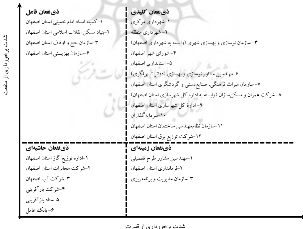
شکل (۳): الگوی طبقه‌بندی ۲۵ بازیگر اصلی در فرایند مشارکت الکترونیکی بافت فرسوده شهر اصفهان

۱. ساکنان بافت فرسوده شهر اصفهان منفعت زیادی در بازآفرینی شهری دارند ولی سهم برخورداری آن‌ها از قدرت اندک است، به این دلیل، در فهرست ذی‌نفعان کلیدی (بر پایه ماتریس استاندارد قدرت-منفعت) قرار نمی‌گیرند. در مقابل، اهمیت نقش آن‌ها به‌عنوان جمعیت هدف (جمعیت آماج) فرایندهای مشارکت‌پذیری اجتماع محلی مورد تأکید قرار می‌گیرد که منافع قابل توجهی نیز برای آن‌ها دارد.