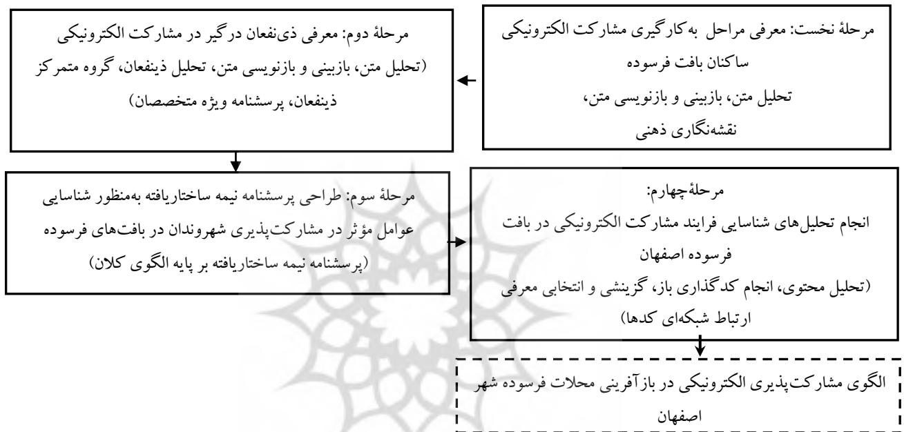
شکل (۱): معرفی فرایند انجام پژوهش (روش‌شناسی پژوهش مقاله)

بیکاری، فقر و آلودگی محیطی را در خود جای داده‌اند (کلانتری و همکاران، ۱۳۷۵: ۷۳) این بافت‌ها که گاه بافت‌های ناکارآمد نیز نامیده می‌شود (شفاهی و همکاران، ۱۳۸۵: ۱۸۶)؛ در قیاس با دیگر پهنه‌های شهری از توسعه کمتری بهره برده‌اند و به کانون نارسایی‌ها و مشکلات تبدیل شده‌اند (خرایی و همکاران، ۱۳۹۹) و دارای ویژگی‌های مانند قدمت ۵۰ سال به بالا در ۸۰ درصد ساختمان‌ها در این بافت‌ها، ریزدانه‌گی با مساحت کمتر از ۲۰۰ مترمربع برای ۶۰ درصد ساختمان‌ها، نوع مصالح به کاررفته عمدتاً خشتی، خشت و آجر و چوب و فاقد سیستم سازه‌ای مناسب، تعداد طبقات کمتر از دوطبقه در این بافت‌ها می‌باشد. علاوه بر این در برخی از نواحی مشکلات مالکیتی نیز در بافت‌های فرسوده به چشم می‌خورد. (مطالعات کاربردی و امور تدریجی، ۱۳۹۵؛ مصوب شورای عالی شهرسازی و معماری، ۱۳۸۴) این بافت‌ها در چهار گونه بافت‌های با ارزش تاریخی، بافت‌های فاقد ارزش تاریخی، بافت‌های حاشیه‌ای (سکونتگاه‌های غیررسمی) و بافت روستا- شهری قرار گرفته است (شفائی و همکاران، ۱۳۸۵)