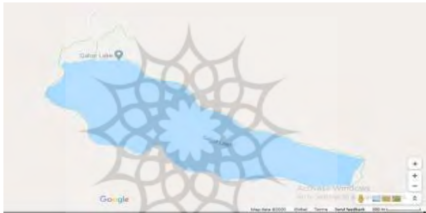
شکل ۱. نقشه دریاچه گهر

ایران از جاذبه‌های طبیعی گردشگری فراوانی برخوردار است که از آن جمله دریاچه گهر است. دریاچه گهر دریاچه‌ای کوهستانی است که در میان رشته کوه اشتران کوه استان لرستان با ارتفاع ۲۳۵۰ متر از سطح دریا واقع شده است و حدود ۱۷۰۰ متر درازا و ۴۰۰ تا ۸۰۰ متر پهنا و ۴ تا ۲۸ متر ژرفا دارد. این دریاچه در منطقه حفاظت شده اشتران کوه شهرستان دورود قرار دارد که به نگین اشتران کوه معروف است و به علت نداشتن راه ماشین رو منطقه بکری است و تا حد زیادی در امان مانده است از گزند انسان. سالانه حدود ۷۰.۰۰۰ گردشگر از این منطقه بازدید می‌کنند. مسیر اصلی دریاچه از شهرستان دورود شروع می‌شود و پس از طی مسافت حدود ۱۸ کیلومتر به انتهای آسفالت شده جاده می‌رسد. از این نقطه تا رسیدن به دریاچه گهر حدود پنج ساعت پیاده روی لازم است (سایت دریاچه گهر، ۱۳۹۸).